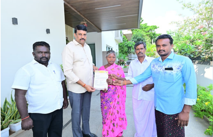
కుటుంబాన్ని రోడ్డున పడదీయకుండా చూసే గొప్ప మానవతావాది ఆయన. తెలుగుదేశం పార్టీ కార్యకర్తల వైద్యముక అని, వారి సంక్షేమం కోసం చంద్రబాబు తీసుకున్న ఈ నిర్ణయం నేడు చనిపోయిన వారి కుటుంబానికి కొండంత అండగా నిలిచిందని పేర్కొన్నారు. బాపట్ల నియోజకవర్గంలో ప్రతి కార్యకర్తకు తాను అండగా ఉంటానని, లోకేష్ బాబు కూడా కార్యకర్తల సంక్షేమంపై ప్రత్యేక దృష్టి సారించారని ఎమ్మెల్యే వివరించారు. ప్రభుత్వం మరియు పార్టీ పరంగా అంకాలు కుటుంబానికి అన్ని విధాలా సహాయ సహకారాలు అందిస్తామని హామీ ఇచ్చారు. రాష్ట్ర అభివృద్ధి కోసం అత్యుత్తమ శ్రమిస్తూనే, మరోవైపు కార్యకర్తల సామాజిక భద్రత కోసం అలోచించే ఏకైక నాయకుడు చంద్రబాబు నాయుడు ని, ఆయన నాయకత్వంలో పనిచేయడం మనందరి అదృష్టమని నరేంద్ర వర్మ రాజు ఈ సందర్భంగా ఉద్ఘాటించారు. ఈ కార్యక్రమంలో పార్టీ ప్రముఖులు, స్థానిక నాయకులు మరియు పెద్ద సంఖ్యలో కార్యకర్తలు పాల్గొని చంద్రబాబు నాయుడు కి, ఎమ్మెల్యే నరేంద్ర వర్మ కి కృతజ్ఞతలు తెలిపారు.