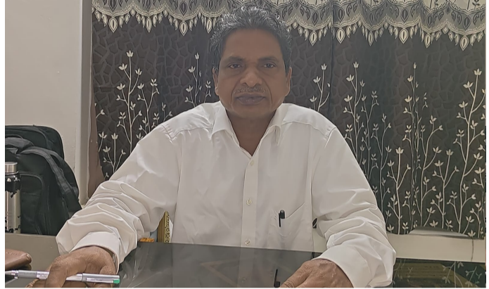
మొత్తం 7676 పెన్షన్ దారులకు 3,32,30,500 కోట్లు మండలంలో పెన్షన్లు పంపిణీ జరుగుతుందని ఆయన తెలిపారు.

పెన్ పవర్ బ్యూరో బాపట్ల మార్చి 31: కర్ణాటక మండల పరిధిలో ఉన్న 20 గ్రామపంచాయతీలో రేపు ఉదయం పెన్షన్ దారులకు పెన్షన్ అందిస్తున్నామని కర్ణాటక ఎంపీ డి.ఎం. అద్వైతి శ్రీనివాసరావు అన్నారు. మంగళవారం స్థానిక ఎంపీ డి.ఎం. అద్వైతి ఆయన మాట్లాడుతూ రేపు సచివాలయం సిబ్బంది మీ ఇంటి దగ్గరికి వచ్చి ఉదయం 6 గంటలకు అల్లా అందరికీ పెన్షన్లు అందిస్తారని ఆయన తెలిపారు. ఈ పెన్షన్లు పంపిణీ చేయడానికి మండలంలో 160 మంది సచివాలయం సిబ్బంది నియమించినట్లుగా ఆయన తెలిపారు.