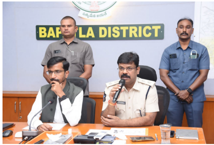
యంత్రాంగంపై ఉండవచ్చు సషా ముక్తి భారత్ లక్ష్యంతో పోలీసు అధికారులు సమర్థంగా పనిచేయాలని జిల్లా ఎస్సీ గారు తెలిపారు. డ్రగ్స్ రహిత సమాజం కొరకు అధికారులు నిరంతరం కృషి చేయాలన్నారు. శక్తి బృందాలు, ఈగల్ బృందాలు మరింత చురుకుగా వ్యవహరించాలన్నారు. మొదటి విడతలో చేపట్టిన అవగాహన ప్రచార కార్యక్రమాలు సత్ఫలితాలను ఇచ్చాయన్నారు. ఇదే మాదిరిగా రెండో విడతలోను జిల్లా వ్యాప్తంగా విస్తృతంగా అవగాహన ప్రచార కార్యక్రమాలు నిర్వహిస్తామన్నారు. ఇందు కొరకు సమగ్ర ప్రణాళిక రూపొందించామన్నారు. మాదకద్రవ్యాల అక్రమ రవాణా, వినియోగం పూర్తిగా అరికట్టడానికి విద్యా, వైద్య ఆరోగ్యశాఖలతోపాటు ఆర్ పి ఎఫ్, రవాణా శాఖ వంటి అనుబంధ శాఖల అధికారులు తమ సహకారం అందించాలన్నారు. ఎన్ఫీఆర్ భరోసా పింఛన్ పంపిణీ సమయంలో సవివాలయాల స్టాయి వెల్ఫేర్ సెక్రటరీ, మహిళా పోలీసులు గ్రామాలలో విస్తృత ప్రచారం చేయాలన్నారు. అవగాహన కార్యక్రమాలతోనే గంజాయి, మాదకద్రవ్యాల భారిన పడకుండా ప్రజలను కాపాడవచ్చన్నారు. గంజాయి ప్రభావానికి యువత గురికాకుండా కళాశాలలో అవగాహన కార్యక్రమాలు విస్తృతంగా నిర్వహించడానికి చర్యలు తీసుకుంటామన్నారు. ప్రస్తుతం గుర్తించిన 74 హాట్ స్పాట్ లలో పోలీసు నిఘా ఉంచామన్నారు. మాదకద్రవ్యాల వినియోగం, అక్రమ రవాణాపై ఏదైనా అనుమానిత ప్రాంతాలు, వ్యక్తులు ఉన్నట్లు అధికారులు గుర్తిస్తే తక్షణమే సమాచారం ఇవ్వాలని ఆయన సూచించారు ఈ సమావేశంలో బాపట్ల, చీరాల డివిజన్లు పి.జగదీష్ నాయక్, ఎం.డి.మోయన్, చీరాల ఆర్డీవో బి.చంద్రశేఖర్, ఈగల్ సెల్ సిబ్బంది, వివిధ శాఖల జిల్లా అధికారులు, తదితరులు పాల్గొన్నారు.