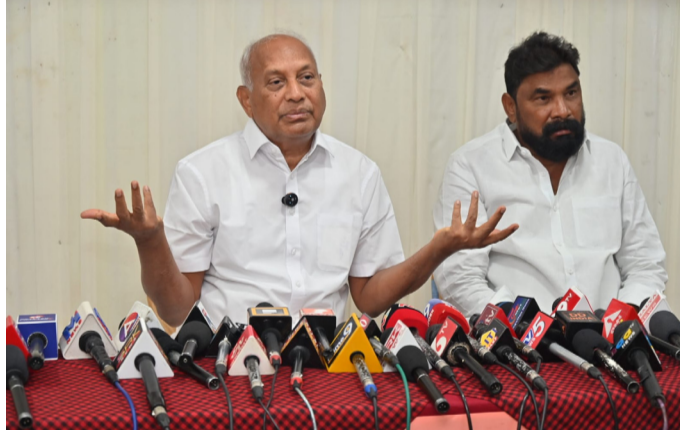
వ్యవహరిస్తున్నారు. ఎన్ డి ఏ ప్రభుత్వం లుంపే కి లోంగిపోయింది. గ్యాస్ సిలిండర్ అందలేదని ఓ మహిళ ఆత్మ హత్యకు పాల్పడిన విషయం తెలిసిందే. ప్రతి ఇంట్లో యుద్ధ ప్రభావం చూపుతోంది. గ్యాస్, పెట్రోల్, డిజిల్ సమస్య విపరీతంగా వుంది. ప్రతి ఒక్కరూ ఆందోళన చెందుతున్నారు. ఫిబ్రవరి 1991 ఇలాకా, కువైట్ మధ్య యుద్ధం జరిగింది. మాజీ ప్రధాని రాజీవ్ గాంధీ గారు, ఢిల్లీ నుంచి మాస్కోకు వెళ్లి, గార్బుచేవ్ తో మాట్లాడారు. యుద్ధం విరమించాలని పట్టుపట్టారు. అక్కడి నుంచి బెర్లిన్ వెళ్లి, ప్రపంచ దేశాల అధినేతలతో మాట్లాడి, ఆ తర్వాత సర్దా మంస్నీన్ తో మాట్లాడారు. యుద్ధం విరమణ అయ్యంతో వరకు బెర్లిన్ లో ( ఫిబ్రవరి 24 నుంచి 28 వరకు 1991) వరకు ఆక్కడి ఉన్నారు. ఆ తరువాత రాజీవ్ గాంధీ ఢిల్లీకి వచ్చారు. ఇది తేడా. అప్పటి ప్రధాని ప్రధాన మంత్రికి ఇప్పటి ప్రధాన మంత్రికి, కాంగ్రెస్ పార్టీ కి, బిజెపికి తేడా. రాజీవ్ గాంధీ ధైర్య సాహసాలు, సమర్థత ఎవరికీ లేదు. ప్రపంచ యుద్ధాన్ని ఆపిన ఘనత చరిత్ర రాజీవ్ గాంధీదే. అమరావతిని రాయలసీమ ప్రజలు అంగీకరించడం లేదు. చంద్రబాబు నాయుడు ప్రయత్నాలు సఫలీకృతం కాదు. అప్పులు చేసి, అమరావతి లో ఖర్చు చేసి, రాష్ట్ర ప్రజలు నెత్తిన పెనుభారం మోపుతున్నాడు నా మిత్రులు చంద్రబాబు నాయుడు. ఈ విలక్షణం సమావేశంలో ఎస్సీ నాయకులు అన్నవరపు కిషోర్ పాల్గొన్నారు...