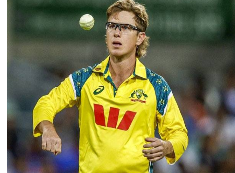
నాణ్యమైన స్థానిక ఆటగాళ్లు అందుబాటులో ఉండటంతో విదేశీ స్పిన్నర్లకు పెద్దగా డిమాండ్ ఉండటం లేదు. జంపా వ్యాఖ్యలు ఇదే విషయాన్ని స్పష్టం చేస్తున్నాయి.