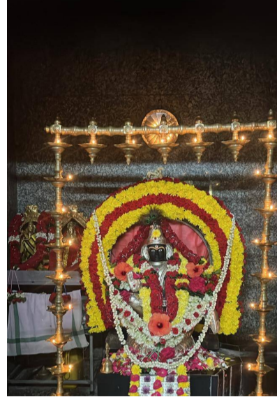
సమన్వయంతో కార్యక్రమాన్ని విజయవంతంగా నిర్వహించారు.