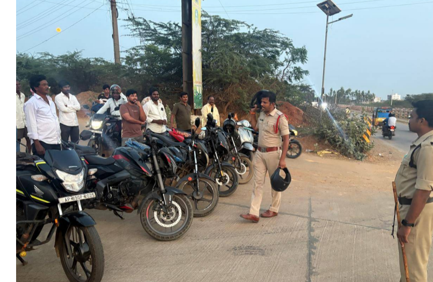
జగంపేట, పెన్ పవర్, ఏప్రిల్ 1: జగంపేటలోని గోకవరం రోడ్డులో బుధవారం సాయంత్రం హెల్మెట్ వినియోగంపై ద్వైచక్ర వాహనంపై ప్రయాణించే వారు కచ్చితంగా హెల్మెట్ ధరించాలని సూచించారు. హెల్మెట్ ధరించకపోతే జరిగే ప్రమాదాలను తెలియజేశారు.