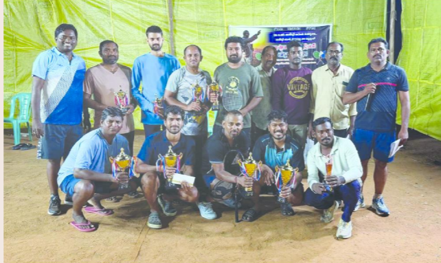
అధ్యక్షి ఆర్.సి (పెన్ పవర్), ఏప్రిల్ 13

ప్రకాశం జిల్లా, కొరికపాడు మండలం, మేదరమెట్ల గ్రామంలోని జెడ్పీ హైస్కూల్లో మైదానంలో అంబేద్కర్ జయంతిని పురస్కరించుకొని నిర్వహించిన నియోజకవర్గ స్థాయి డబుల్ బ్యాడ్మింటన్ పోటీలు సోమవారం ఘనంగా ముగిసాయి. స్థానిక అంబేద్కర్ యూత్ ఆర్గనైజ్మెంట్లో గత కొన్ని రోజులుగా సాగుతున్న ఈ క్రీడా సంబంధాలను వివరించే రోజున