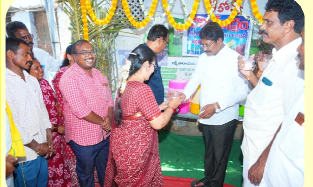
అర్జవీడు, పెన్ పవర్, ఏప్రిల్ 13