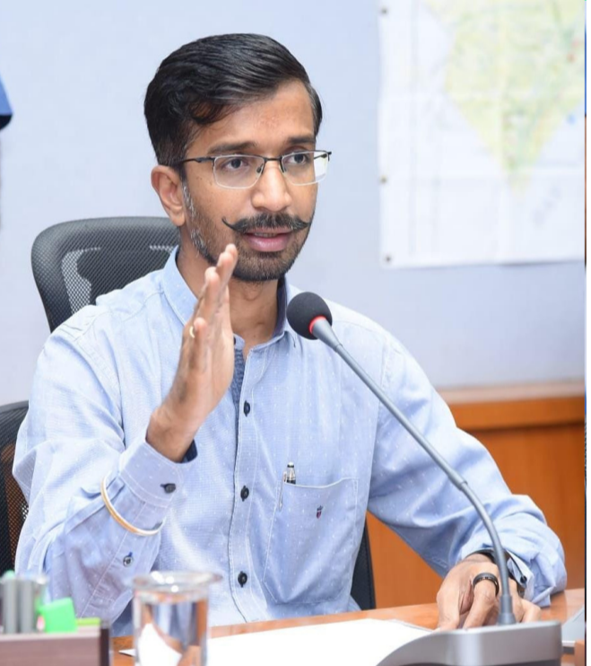
ప్రతినిధులు, జిల్లా అధికారులు, జిల్లాలోని ఎస్ సి, ఎస్ టి, బి సి, మైనార్టీల సంఘాల నాయకులు తదితరులు పాల్గొనాలని జిల్లా కలెక్టర్ ఆ ప్రకటనలో తెలిపారు.