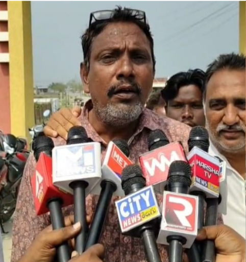
డిఎఫ్.ఓ. తమ బాధ్యతను ఎంతవరకు నెరవేరుస్తున్నారో ఆర్ఎఫ్.ఓ. విచారణ జరిపి ప్రజలకు తెలియజేయాలని డిమాండ్ చేశారు. ప్రజల భద్రత కోసం సంబంధిత అధికారులు తక్షణం చర్యలు తీసుకోవాలని ఆయన కోరారు.