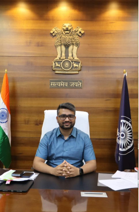
కల్పించేందుకు వార్డ్ సచివాలయాల వారిగా కార్యక్రమాలు చేపట్టనున్నామన్నారు. ఈ జబ గణన కార్యక్రమాన్ని విజయవంతం చేసేందుకు నగర ప్రజలందరూ సహకరించాలని, ముఖ్యంగా స్వయం గణన సదుపాయాన్ని సద్వినియోగం చేసుకోవాలని పిలుపునిచ్చారు.