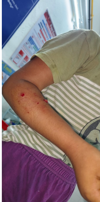
వెల్లినా కుక్కలు ప్రజలను వెంటాడి తరముతున్నాయి. స్థానిక మండల

పెన్ పవర్ కారంపూడి ఏప్రిల్ 12 : స్థానిక కారంపూడి మండల పరిధిలోని దాచేపల్లి రోడ్డు వద్ద తోట బజారు పరిసర ప్రాంతాల్లో ఆదివారం, సోమవారం, సుమారు పదిమంది పిల్లలు వుద్ధులపై పిచ్చి కుక్కలు దాడులు చేశాయి. గ్రామంలో ఎక్కడ చూసినా కుక్కల బెడద ఎక్కువవుతోంది. రోజూ రోజూకూ శునకాలు జనంపై దాడులు చేస్తూ ప్రజలను బెంబేలెత్తిస్తున్నాయి. రోడ్లపై, ఇళ్ల వద్ద, దుకాణాల్లో, వీధులలో కుక్కలు స్వైర విహారం చేస్తూ స్థానిక ప్రజలను భయాందోళనలకు గురి చేస్తున్నాయి. కుక్కల నుండి రక్షించుకోవడానికి ప్రజలు పెద్ద యుద్ధమే చేయాల్సి వస్తోంది. ప్రజలు తమ పిల్లలను పాఠశాలకు పంపించాలన్నా, నిత్యావసర సరుకులు, కూరగాయలు వంటివి తీసుకు రావడానికి వీధులలోనికి