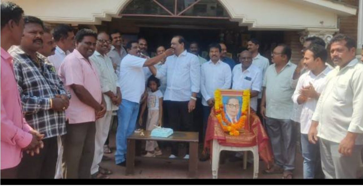
విశాఖ పశ్చిమ, పేన్ పవర్, ఏప్రిల్ 14 : భారత రాజ్యాంగ శిల్పి డాక్టర్ బి.ఆర్. అంబేద్కర్ 135వ జయంతి సందర్భంగా జనసేన