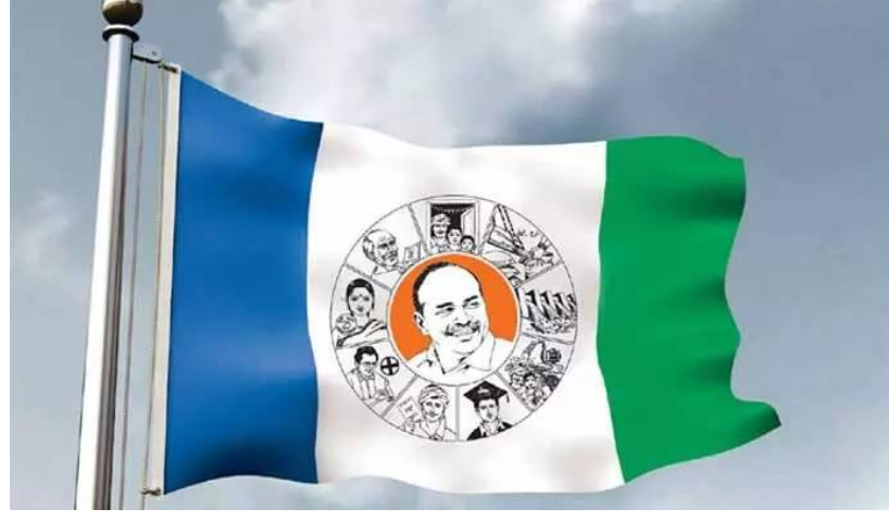
ప్రాంతానికి ఖర్చు చేస్తే మిగిలిన ప్రాంతాలు ఎలా అభివృద్ధి చెందుతాయని వారు ప్రశ్నిస్తూ గత ఎన్నికల్లో ఉత్తరాంధ్రలో కోల్పోయిన పట్టును తిరిగి సంపాదించే పనిలో వైసీపీ పడిందని భావించాలి.మరోకవైపు రాయలసీమ ఎత్తిపోతల పథకంపై వైసీపీ ఇటీవల ఆందోళనకు దిగింది. తెలంగాణ ప్రభుత్వం

నెల్లూరు, ఏప్రిల్ 14, పెన్ పవర్: సీపీ సెంటిమెంట్ తో జనం ముందుకు వెళుతుంది. అది ఎంత వరకూ సక్సెస్ అవుతుందో తెలియదు కానీ... ప్రాంతాల వారీగా వైసీపీ ఆ ప్రాంత ప్రధాన సమస్యలపై ఉద్యమం చేస్తూ తిరిగి పుంజుకోవాలని చూస్తుంది. చూసేందుకు ఇది మంచి స్ట్రాటజీలాగే కనిపిస్తుంది. దీంతో ఆ ప్రాంత నేతలు బయటకు వస్తున్నారు. అలాగే ప్రజల్లోకి కూడా పార్టీ బలంగా వెళ్లగలుగుతుంది. అంటే రెండు రకాలుగా పార్టీకి ప్రయోజనమేనని అంటున్నారు. జగన్ నిర్దేశించిన మేరకు ఇటు రాయలసీమలోనూ, అటు ఉత్తరాంధ్రలోనూ వేర్వేరు సమస్యలపై వైసీపీ పోరాటం చేయడం రానున్న ఎన్నికల్లో తమకు కలిసి వస్తుందని వైసీపీ గట్టిగా భావిస్తుంది.ఉత్తరాంధ్రలో ఇటీవల మూలాపేట పోర్టు నిర్వాహాన్ని నిలిపివేయడంపై వైసీపీ నేతలు ఆందోళనకు దిగారు. తాము అధికారంలో ఉండగా 70 శాత పనులు పూర్తి చేస్తే కూటమి ప్రభుత్వం వచ్చిన తర్వాత మూలాపేట పోర్టు నిర్వాహాన్ని పూర్తి చేయకుండా నిధులన్నీ అమూనాపై నిర్వాహానికి ఖర్చు పెడుతుందని సెంటిమెంట్ ను ఆ ప్రాంత ప్రజల్లో కలిగించేలా నేతలు మాట్లాడారు. నిధులన్నీ ఒక్క