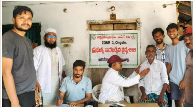
సి ఎస్ పురం, పెన్ పవర్ ఏప్రిల్ 17