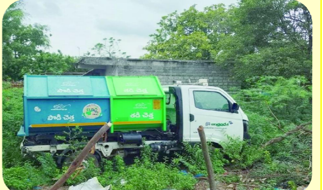
కొనకసమిట్ల పెన్ పవర్ ఏప్రిల్ 17

మండలంలోని నాగంపల్లి గ్రామంలో చెత్త సేకరణ కోసం ప్రభుత్వం అందజేసిన చెత్త వాహనం వినియోగంలో లేకుండా నిరుపయోగంగా పడి ఉండటం ప్రజల్లో ఆగ్రహం వ్యక్తం అవుతోంది. గ్రామ పరిశుభ్రత కోసం ప్రత్యేకంగా కేటాయించిన ఈ వాహనం మూలకు వచ్చే ఉంచడం వల్ల గ్రామంలో చెత్త పేరుకుపోతుండగా, పారిశుధ్య పరిస్థితులు రోజురోజుకు దిగజారుతున్నాయి. గ్రామ పంచాయతీ పరిధిలో ప్రతి రోజు చెత్త సేకరణ జరగాల్సి ఉండగా సంబంధిత సిబ్బంది నిర్లక్ష్య ధోరణి కారణంగా ఈ వాహనం ఉన్నప్పటికీ దాన్ని ఉపయోగించకుండా వదిలేయడం వల్ల చెత్తను ఎక్కడిక్కడ వేయడం జరుగుతోంది. దీనివల్ల దుర్వాసనలు వ్యాపించి, దోమలు పెరిగి వ్యాధులు ప్రబలి ప్రమాదం ఉందని ప్రజలు ఆందోళన వ్యక్తం చేస్తున్నారు. ప్రభుత్వం గ్రామంలో పరిశుభ్రత కోసం కోట్ల రూపాయలు ఖర్చు చేస్తూ వాహనాలు, నదువాయలు కల్పిస్తున్నప్పటికీ, వాటిని సక్రమంగా వినియోగించకపోవడం అధికారమని స్థానికులు అంటున్నారు. ఈ విషయంపై సంబంధిత అధికారుల పర్యవేక్షణ లేకపోవడం వల్లే ఇలాంటి పరిస్థితులు నెలకొన్నాయని గ్రామస్థులు అభిప్రాయపడుతున్నారు. వెంటనే స్పందించి చెత్త వాహనాన్ని వినియోగంలోకి తీసుకురావాలని, గ్రామంలో రోజువారీ చెత్త సేకరణ చేపట్టి గ్రామ పరిశుభ్రతపై దృష్టి సారించాలని గ్రామస్థులు కోరుతున్నారు.