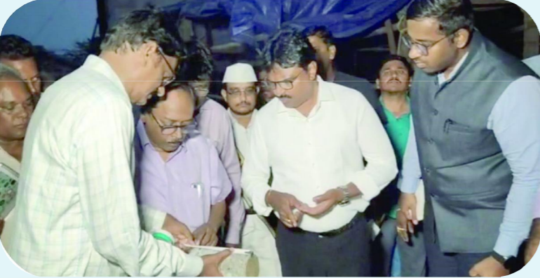
పాడేరు, పెన్ పవర్, ఏప్రిల్ 17