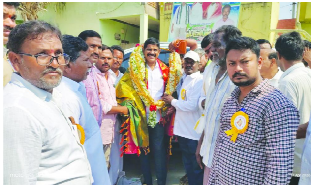
గిద్దలూరు పెన్ పవర్ ఏప్రిల్ 17