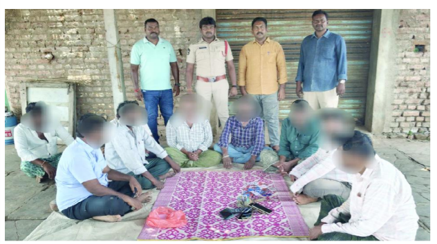
కందుకూరు పెన్ పవర్, ఏప్రిల్ 17