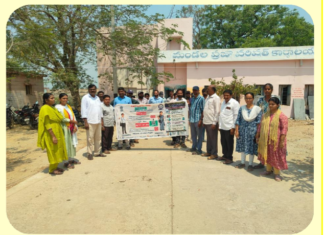
పుల్లల చెరువు పెన్ పవర్ ఏప్రిల్ 17

మండల కేంద్రంలో స్వయం గణన పై విస్తృత అవగాహన కార్యక్రమం ఎంపీడివో ఆధ్వర్యంలో నిర్వహించారు. ప్రజలకు స్వయంగా గణన ప్రక్రియను ఎలా పూర్తి చేయాలి తెలియజేయడానికి అధికారులు ప్రత్యేక చర్యలు చేపట్టారు. మండల పరిషత్ కార్యాలయం నుంచి బస్టాండ్ సెంటర్ వరకు నిర్వహించిన ర్యాలీ ఆకట్టుకుంది. స్వయం గణన ప్రాముఖ్యతను తెలియజేస్తూ షూకార్లు, నినాదాలతో సచివాలయ సిబ్బంది పాల్గొని ప్రజల్లో చైతన్యం రేకెత్తించారు. అనంతరం ప్రజలతో మమేకమై గణన విధానం గురించి వివరణ ఇచ్చారు. ఈ సందర్భంగా ఎంపీడివో మరియాదాస్ మాట్లాడుతూ స్వయం గణన ప్రతి పౌరుడి బాధ్యత అని స్పష్టం చేశారు. ఖచ్చితమైన వివరాలు అందించడం ద్వారా ప్రభుత్వ పథకాలు సమర్థవంతంగా అమలవుతాయని పేర్కొన్నారు. గణన ప్రక్రియను సులభంగా పూర్తి చేసుకునే విధానంపై దశలవారీగా మార్గదర్శకాలను వివరించారు. ఈ కార్యక్రమంలో సచివాలయ సిబ్బంది పాల్గొన్నారు.