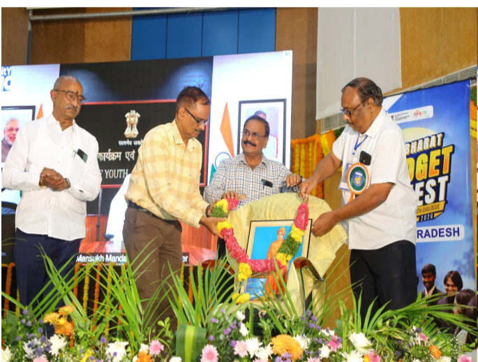
రంగాలకు చెందిన నిపుణులతో రెండు ప్యానెల్ చర్చలు నిర్వహించి, బడ్జెట్ అంశాలపై యువతకు అవగాహన కల్పించారు. సాంకేతిక నైపుణ్యం ప్రధానమంత్రితో ముఖాముఖి కోసం అత్యధునిక 1080జూ రిజల్యూషన్ కలిగిన వీడియో కాన్ఫరెన్సింగ్ వ్యవస్థను మరియు నిరంతర ఇంటర్నెట్ సదుపాయాన్ని ఏర్పాటు చేశారు. యువతకు సందేశం..