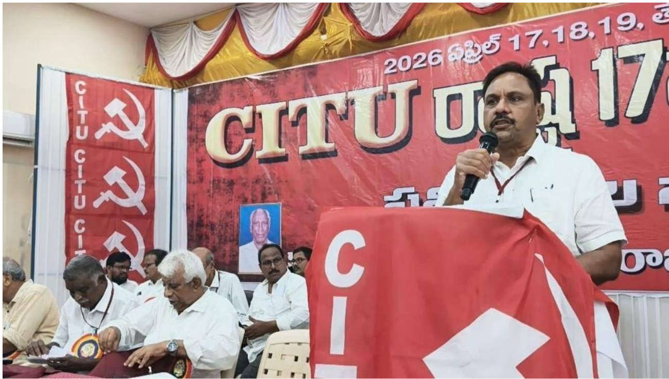
కూరూర్ పాఠశాల: పెన్ పవర్, ఏప్రిల్ 19:కేంద్ర ప్రభుత్వం విశాఖ స్ట్రీట్ షాంట్ అమ్మకం ఆపాలని, సొంత ఐరన్ ఓర్ గనులను కేటాయించాలని,