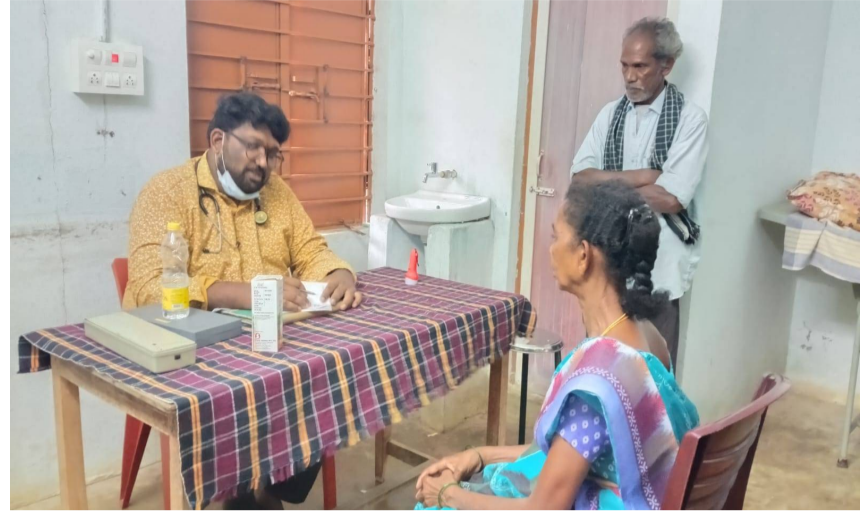
150 మందికి వైద్య సేవలు