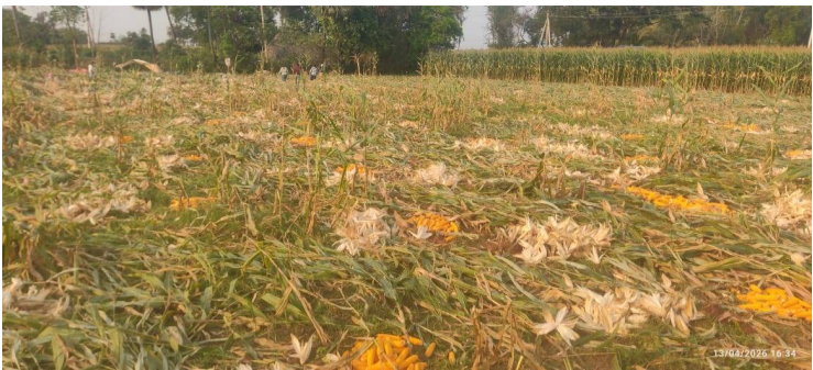
ఎండ--మేఘాల మార్పులు కొనసాగుతుండటంతో పంటల పనులు అలస్యమవుతున్నాయి. వాతావరణ పరిస్థితులు స్థిరపడాలని రైతులు కోరుతున్నారు.

పచ్చని గ్రామాల్లో రైతులు వరి, మొక్కజొన్న, చొడి పంటల పనుల్లో బిజీగా ఉన్న వేళ వాతావరణ మార్పులు వారికి ఇబ్బందులు సృష్టించాయి. ఉదయం నుంచి మధ్యాహ్నం మూడు గంటల వరకు తీవ్ర ఎండలు ఉండగా, అనంతరం అకస్మాత్తుగా దట్టమైన మేఘాలు కమ్ముకుంటున్నాయి. ఎండను ఆనగా చేసుకుని పంటను సూర్యు వేయడానికి, ఎండ బెట్టడానికి ప్రయత్నిస్తున్న రైతులు మేఘావృత వాతావరణంతో ఇబ్బందులు పడుతున్నారు. ఎండలో ఎండబెట్టిన ధాన్యం మళ్లీ తేమ పీల్చుకోవడం వల్ల నాణ్యత దెబ్బతింటుందని రైతులు ఆందోళన వ్యక్తం చేస్తున్నారు. ఇటీవలి రోజు లుగా ఈ