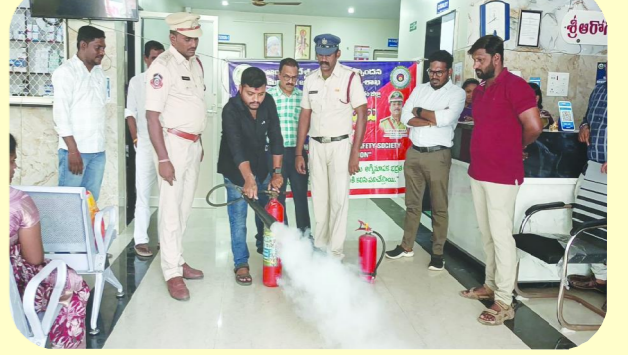
మార్కాపురం టౌన్ పెన్ పవర్ ఏప్రిల్ 19