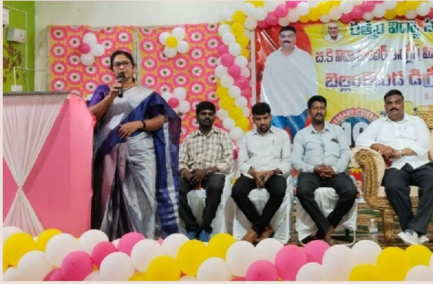
సి ఎస్ పురం, పెన్ పవర్ ఏప్రిల్ 19