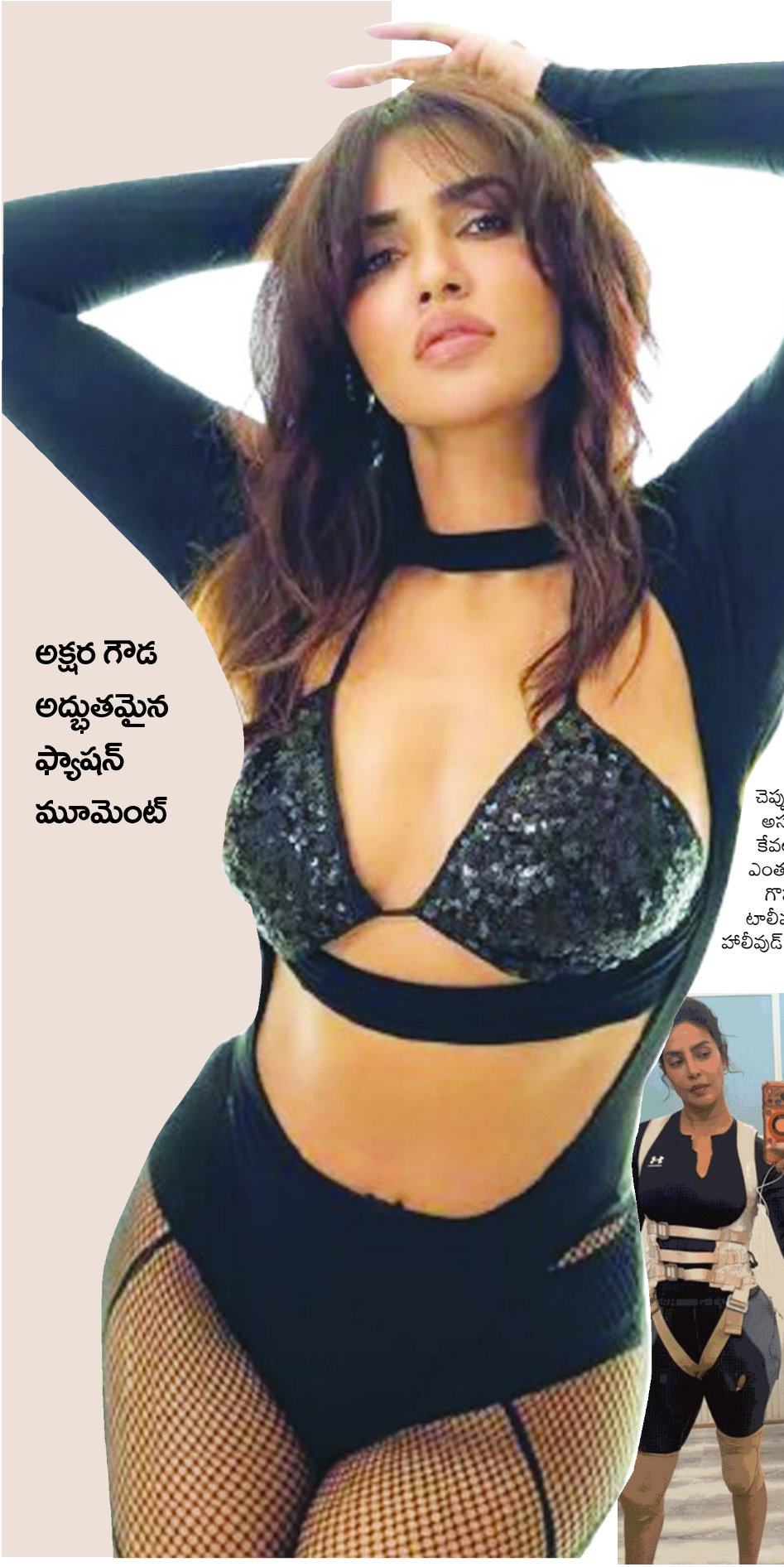
అక్షర గౌడ అద్భుతమైన ఫ్యాషన్ మూమెంట్

చూపిస్తున్నట్లు వార్త కథనాలు వస్తున్నాయి. టీ20ల్లో నంబర్-4 స్థానానికి అయ్యర్ సరైన ప్రత్యామ్నాయమని టీసీసీఐ భావిస్తుంది. శ్రేయాస్ అయ్యర్ ఇప్పటి వరకు జాతీయ జట్టుకు కెప్టెన్ పదవీధి వహించినప్పటికీ, దేశవాళీ క్రికెట్ తో పాటు ఐపీఎల్లో కెప్టెన్ గా అతడికి మంచి ట్రాక్ రికార్డు ఉంది. శ్రేయాస్ ప్రస్తుతం పంజాబ్ కింగ్స్ జట్టుకు నాయకత్వం వహిస్తున్నాడు. అంతకుముందు ఐపీఎల్-2024 సీజన్ లో కేకేఆర్ కి ట్రోఫీ అందించాడు. గత సీజన్లో పంజాబ్ జట్టుని సైతం పైసల్ చేర్చాడు. ఈ ఏడాది కూడా అతడి సారథ్యంలోనే కింగ్స్ టీమ్ అద్భుత విజయాలతో దూసుకుపోతుంది. ఇక శ్రేయాస్ డౌమాస్టిక్ క్రికెట్ లో కూడా ముంబై జట్టుకు ఎన్నో విజయాలను అందించాడు. దీంతో అతడికి జాతీయ జట్టును నడిపించే సత్తా కూడా ఉందని క్రికెట్ పండితులు చెబుతున్నారు. ఇందులో భాగంగా టీ20 జట్టు పగ్గాలు శ్రేయాస్ అయ్యర్ కి ఇచ్చే అవకాశాలు ఎక్కువగా ఉన్నాయని ప్రచారం జరుగుతుంది.