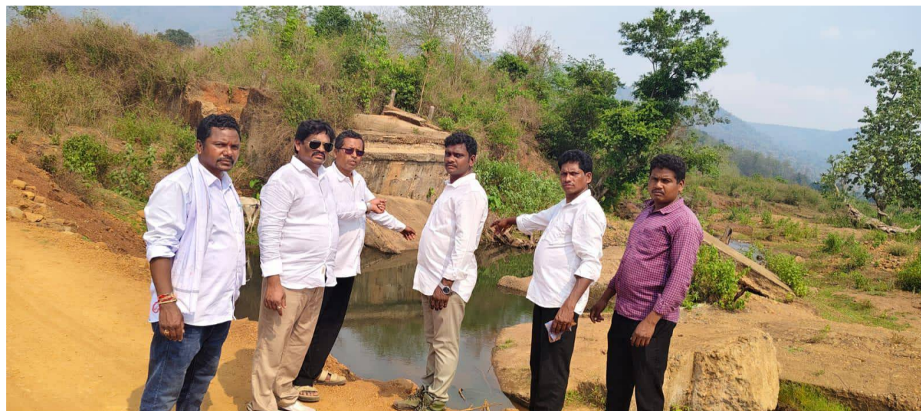
“బ్రిడ్జి లేక ఇబ్బందులు... అధికారుల నిర్లక్ష్యంపై మండిపాటు” సూర్యకాంత్రవీధి, పెన్ పవర్, ఏప్రిల్ 30: మండలంలోని చారకొండ

పంచాయతీ చిన్న గంగవరం వద్ద కొట్టుకుపోయిన బ్రిడ్జి నిర్మాణంపై ఇప్పటికీ ఎలాంటి చర్యలు తీసుకోలేదని వైఎస్సార్ కాంగ్రెస్ పార్టీ నాయకులు