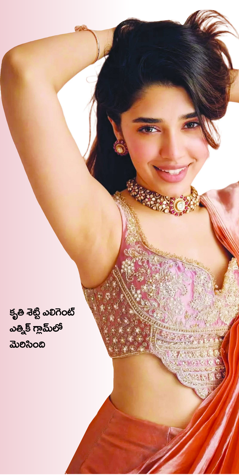
కృతి శెట్టి ఎలిగెంట్ ఎత్తిక్ గ్లామ్ లో మెరిసింది

రికార్డు సృష్టించాడు. ఒక ఇన్నింగ్స్ లో 33 ఫోర్లు, 9 సిక్సర్లతో విరుచుకుపడి.. ఈ మైలరాయిని చేరుకోవడం ప్రస్తుత తరం ప్లేయర్స్ కి ఒక కలగానే మిగిలిపోయింది. ఇంటర్నేషనల్ క్రికెట్ లో సిక్సర్ల రాజుగా: సిక్సర్లు బాదడంలో రోహిత్ శర్మకు సాటి ఎవరూ కాలేదు.. క్రికెట్ 3 ఫార్మాట్లలో కలిపి మొత్తం 650కి పైగా సిక్సర్లు బాది వరల్డ్ లోనే అగ్రస్థానంలో నిలిచాడు. వెస్ట్ ఇండీస్ దిగ్గజం క్రిస్ గేల్ పేరుపై ఉన్న ఘనతని తుడిచి పెట్టిన హిట్ మ్యాన్, తన అద్భుతమైన టైమింగ్ తో ‘సిక్స్ మెషిన్’ గుర్తింపు తెచ్చుకున్నాడు.