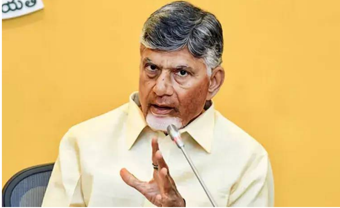
కనిపిస్తున్నాయని" భూములు కొనుగోలు చేస్తున్న వారు అంటున్నారు.