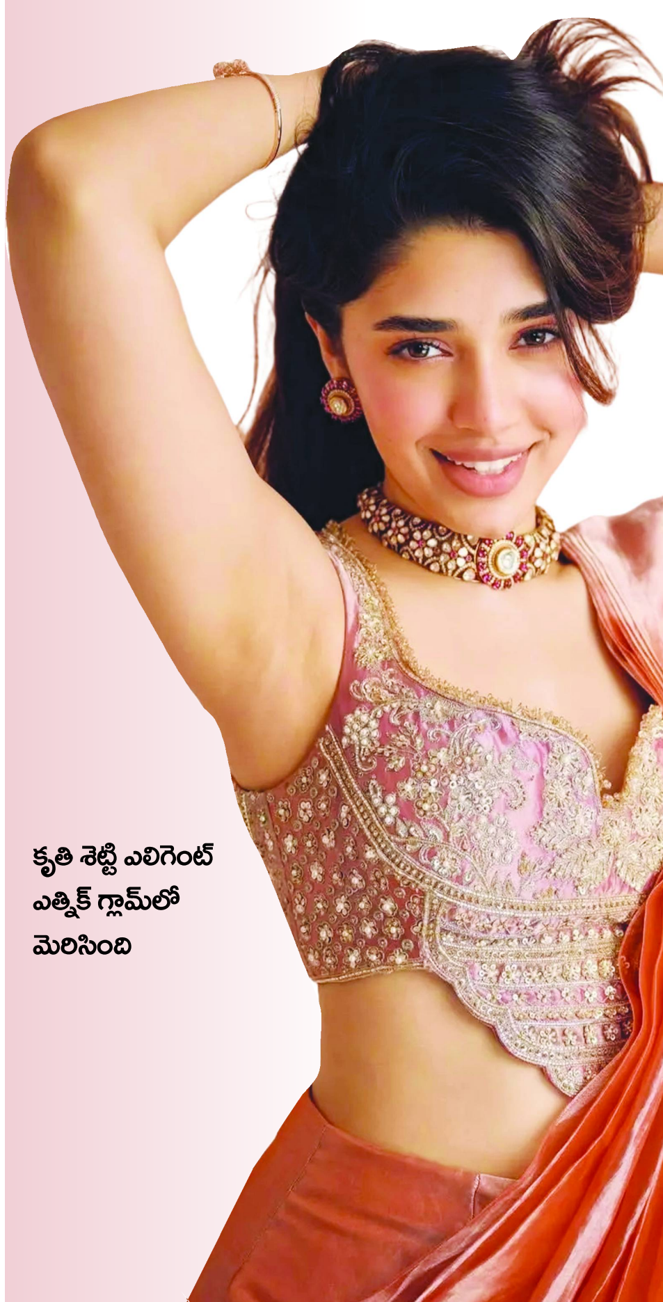
కృతి శెట్టి ఎలిగెంట్ ఎత్తిక్ గ్లామ్ లో మెరిసింది

రికార్డు సృష్టించాడు. ఒక ఇన్నింగ్స్ లో 33 ఫోర్లు, 9 సిక్సర్లతో విరుచుకుపడి.. ఈ మైలరాయిని చేరుకోవడం ప్రస్తుత తరం ప్లేయర్స్ కి ఒక కలగానే మిగిలిపోయింది. ఇంటర్నేషనల్ క్రికెట్ లో సిక్సర్ల రాజు: సిక్సర్లు బాదడంలో రోహిత్ శర్మకు సాటి ఎవరూ రాలేదు.. క్రికెట్ 3 ఫార్మాట్లలో కలిపి మొత్తం 650కి పైగా సిక్సర్లు బాది వరల్డ్ లోనే అగ్రస్థానంలో నిలిచాడు. వెస్టిండీస్ దిగ్గజం క్రిస్ గేల్ పేరుపై ఉన్న ఘనతని తుడిచి పెట్టిన హిట్ మ్యాన్, తన అద్భుతమైన టైమింగ్ తో సిక్స్ మెషిన్ గా గుర్తింపు తెచ్చుకున్నాడు.