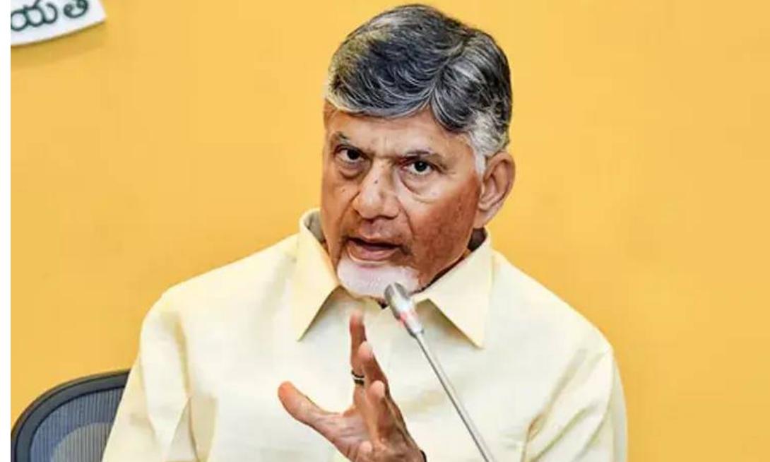
కనిపిస్తున్నాయని" భూములు కొనుగోలు చేస్తున్న వారు అంటున్నారు.