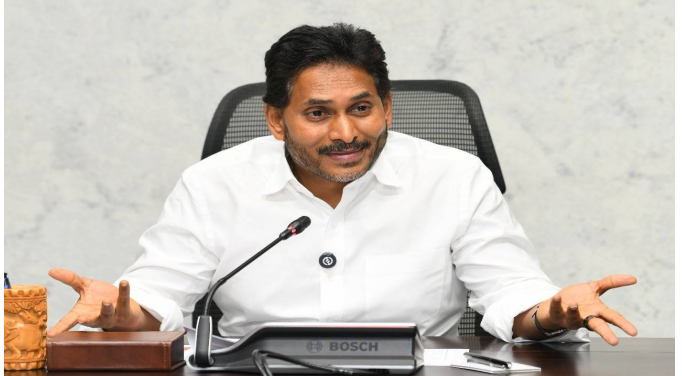
మావిగన్ మాత్రం జగన్ నోటి వెంట రాగానే సోషల్ మీడియా మొత్తం షేక్ అయింది. అంతే కాదు ఏపీ రాజకీయమంతా మొదలు షాక్ అయింది ఆ మీదట హీటెక్కిపోయింది. ఇక మావిగన్ అన్నది ట్రెండింగ్ లో ఉంటూ ట్రోలింగ్ కా బాప్ అనిపించుకుంది. ఇది నెగిటివ్ ప్రచారమా లేక పాజిటివ్ ప్రచారమా అన్నది పక్కన పెడితే వైసీపీని ఎక్కడో తీసికెళ్లి మావిగన్ నే నమ్ముకుంది. ఇక అనేక సార్లు కార్పర్ అవుతూ వస్తోంది. కానీ ఇన్నోవేట్ తరువాత మళ్లీ నాటి హైవే వైసీపీకి క్రియేట్ అయింది అంటే దానికి వన్ అండ్ ఓన్లీ రిజన్ మావిగన్ అని అంటున్నారు. మావిగన్ అన్న మాట అక్కడ పదం వైసీపీని పొలిటికల్ గా ఏపీ రాజకీయ తెర మీద పుల్ ఫోకస్ గా నిలిచేలా చేసింది అని అంటున్నారు. ఇక దీని మీద జరిగిన చర్చ ఇంతా అంతా కాదు అది పాజిటివ్ గా జరిగిందా లేదా నెగిటివ్ గా జరిగిందా అన్నది పక్కన పెడితే వైసీపీ ఎన్నికలకు ప్రతి బోటా వానా అనేది. ఇక విధంగా చూస్తే ఏప్రిల్ నెల మొదటి తేదీన వైసీపీ అధినేత జగన్ వైసీపీ కేంద్ర

కార్యాలయంలో (పెన్ మీట్) పెట్టారు. ఆ రోజున ఆయన మావిగన్ అని ప్రతిపాదించారు. అంతే నాటి నుంచి దాదాపుగా నెల రోజులుగా అదే సోషల్ మీడియాలో తెగ ట్రెండింగ్ అవుతోంది. ఎంతలా అంటే మరో టాపిక్ కూడా కనీసంగా చర్చకు నోచుకోవడంతో ఈ ఒక్క టాపిక్ తోనే వైసీపీ బహుళ ప్రచారం పొందింది. నిజం చెప్పాలంటే ఈ సమయంలో అంటే వైసీపీ భారీ ఓటుమిని అందుకుని వివక్షతో ఉంటూ కేవలం 11 సీట్లతో చరిత్రపడిన వేళ ఆ పార్టీ రాజకీయంగా ఇబ్బందులు పడుతున్న వేళ వచ్చిన ఈ బూస్టింగ్ కానీ జరిగిన ప్రచారం కానీ రూపాయలలో లెక్క కడితే కచ్చితంగా వంద కోట్ల పై మాజీ అంటున్నారు. అంటే పార్టీ ఖజానా నుంచి వంద కోట్లు తీసి పబ్లిసిటీ చేయించుకుంటే వచ్చే పబ్లిసిటీ ప్రీగానే వచ్చేసింది అన్న మాట. ఈ ప్రచారం అంతా మీడియానే మోసింది. భారీగా చేసింది. అది మెయిన్ స్ట్రీమ్ మీడియానా లేక సోషల్ మీడియానా లేక డిజిటల్ ప్లాట్ ఫారం నా అన్నది పక్కన పెడితే ఒక్క మావిగన్ తో వైసీపీ అన్నంగా ఉచిత ప్రచారాన్ని వందల కోట్ల దాకా పొందేసింది. ఇందులో జనాలదే తొంద్రై శాతం పాత్ర అయితే వైసీపీ నుంచి మావిగన్ ని సమర్థించుకున్నా చేసిన ప్రచారం కేవలం పది శాతం మాత్రమే. అంటే ఇంతలా ఇది ప్రచారం అవుతుందని బహుశా వైసీపీ కూడా ఊహించి ఉండదు ఏది ఏమైనా వైసీపీకి ఈ సమయంలో అయితే ఇది బాగా జనంలో ఫోకస్ అయ్యేలా చేసింది మరి ఇది పాజిటివ్ గానా నెగిటివ్ గానా అన్నది పక్కన పెడితే ఒక రాజకీయ పార్టీకి కావాల్సిన ప్రచారం అయితే దక్కింది. ఆ విధంగా వైసీపీ లక్ష్మీ అనే అంటున్నారు.