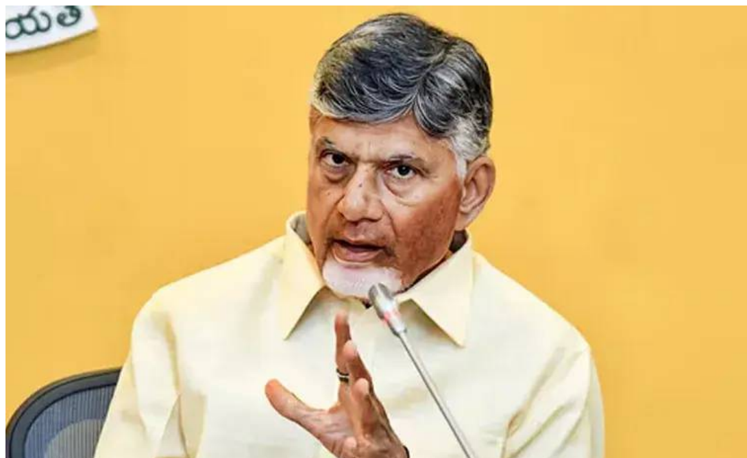
కనిపిస్తున్నాయని" భూములు కొనుగోలు చేస్తున్న వారు అంటున్నారు.