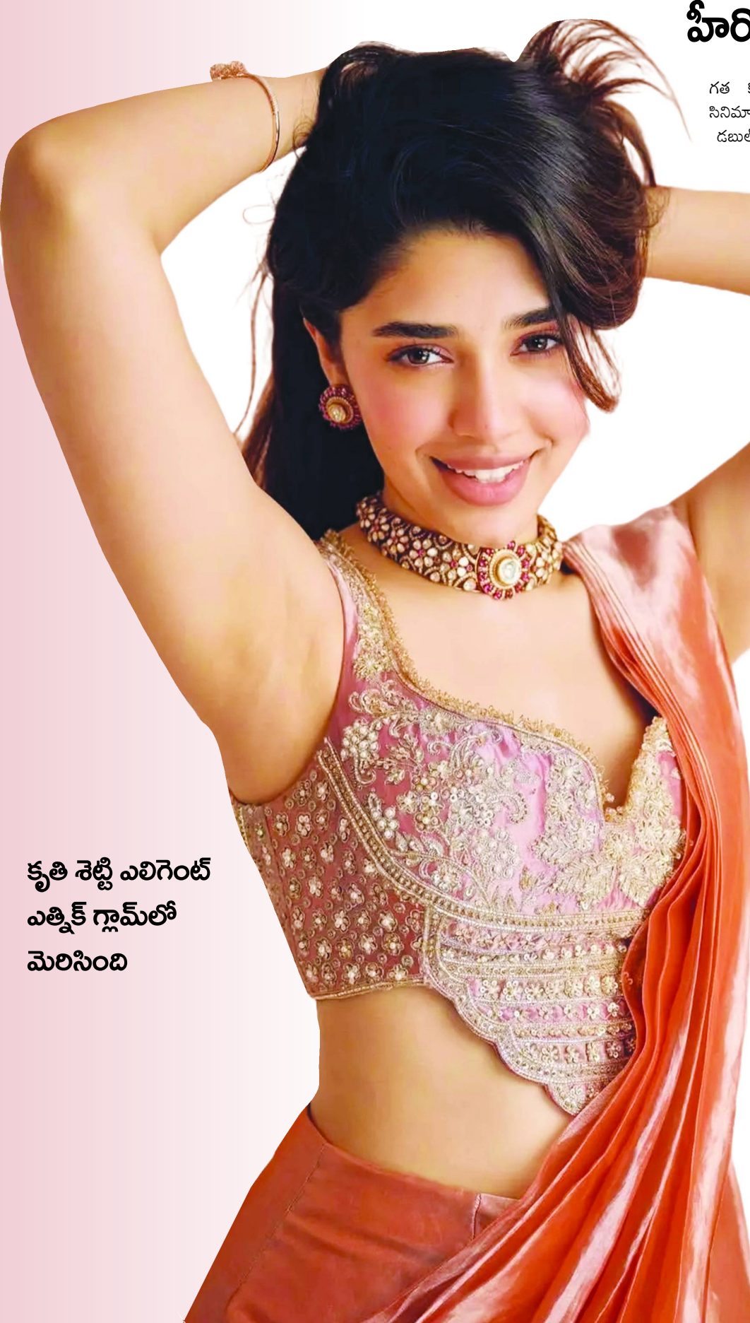
కృతి శెట్టి ఎలిగెంట్ ఎత్తిక్ గ్లామ్ లో మెరిసింది

రికార్డు సృష్టించాడు. ఒక ఇన్స్పిరేషన్ 33 ఫోర్లు, 9 సిక్సర్లతో విరుచుకుపడి.. ఈ మైలాయిని చేరుకోవడం ప్రస్తుత తరం ప్లేయర్స్ కి ఒక కలగానే మిగిలిపోయింది. ఇంటర్నేషనల్ క్రికెట్లో సిక్సర్ల రాజు: సిక్సర్ల బాదడంలో రోహిత్ శర్మకు సాటి ఎవరూ రాలేదు.. క్రికెట్ 3 ఫార్మాట్లలో కలిపి మొత్తం 650కి పైగా సిక్సర్లు బాది వరల్డ్ లోనే అగ్రస్థానంలో నిలిచాడు. వెస్ట్ ఇండీస్ దిగ్గజం క్రిస్ గేట్ పేరుపై ఉన్న ఘనతని తుడిచి పెట్టిన హిట్ మ్యాన్, తన అద్భుతమైన టైమింగ్ తో ‘సిక్స్ మెషిన్’ గుర్తింపు తెచ్చుకున్నాడు.