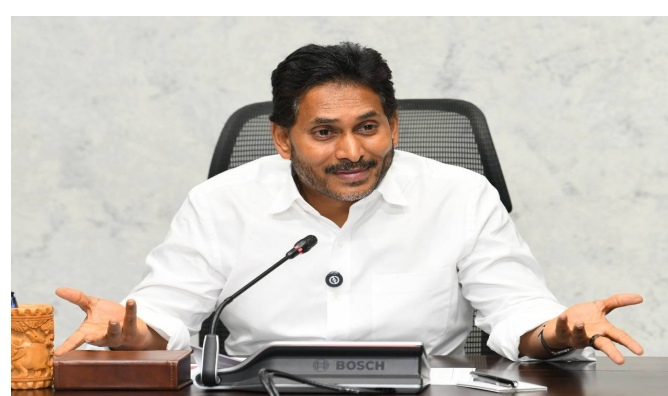
విజయవాడ, ఏప్రిల్ 30, పెన్ పవర్:

వైసీపీ ట్రెడిషనల్ పాలిటిక్స్ కి దూరంగా ఉండే పార్టీ. ఒక భిన్నమైన వైఖరితో సాగే పార్టీ. ప్రచారం విషయంలో చూస్తే ఆ పార్టీ తీరే వేరుగా ఉంటుంది. అవతల ప్రత్యేక టీడీపీ అయితే పబ్లిసిటీ విషయంలో చాలా స్పీడ్ గా ఉంటుంది. పైగా వ్యూహాలు ఎత్తుగడలలో టీడీపీని మించిన వారు ఉండరు. అలాంటి పార్టీతో వైసీపీ ఎప్పుడూ పోటీ పడలేని స్థితిలోనే ఉంటుంది. అలాంటిది వైసీపీ మాదిరి అన్న ఒకే ఒక్క స్టేట్ తో ఏకంగా వంద కోట్ల రూపాయల విలువ చేసే పబ్లిసిటీని ప్రీగా కొట్టివేసి అన్న చర్చ అయితే సాగుతుంది. మావిగన్ అన్నది వైసీపీ కాకపోయినా అన్నదా లేక మనసులో ఉంచుకున్న సలహాదాని వదిలివేసి పంచే నా లేక టీడీపీ కూటమి అమరావతి రాజధాని అన్న బలమైన స్లోగేన్ ఏ ఎంతో కొంత అడ్డుకునేందుకు చేసిన పాపి అన్నది తెలియదు కానీ