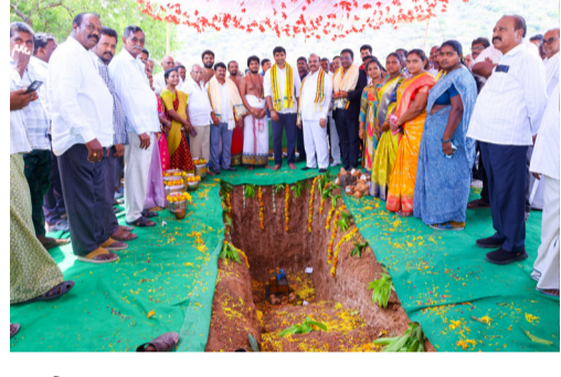
ప్రతిపాటి సూచించారు. కేంద్ర, రాష్ట్ర ప్రభుత్వాల సహకారం.. ద్వాక్రా మహిళల భాగస్వామ్యంతో మండలానికి ప్రాసెసింగ్ యూనిట్ ఏర్పాటు చేస్తాం : ఎంపీ లావు

ముసగ ఆకుతో ఎవరేని ప్రయోజనాలు లభిస్తాయని, రూ.1కోటి 40 లక్షలతో జిల్లాలో మొదటి ముసగ ఆకు ప్రాసెసింగ్ యూనిట్ కు శంకుస్థాపన చేశామని, తొలి దశలో మండలానికి ఒకటి చొప్పున ఏర్పాటుచేసి, అవి విజయవంతమైతే వాటి సంఖ్య మరింత పెంచుతామని ఎంపీ లావు శ్రీకృష్ణ దేవరాయలు పేర్కొన్నారు. కేంద్ర, రాష్ట్ర ప్రభుత్వాల ఆర్థిక సహాయంతో పాటు.. ద్వాక్రా మహిళల భాగస్వామ్యంతో ఈ తరహా ప్రాసెసింగ్ యూనిట్ ఏర్పాటు చేయడంతో పాటు, ఉత్పత్తుల తయారీ, విక్రయ వైపున శిక్షణను కూడా అందిస్తున్నామని ఎంపీ చెప్పారు. ద్వాక్రా సంఘాల ఉత్పత్తులతో పాటు, ప్రాంతాలను బట్టి తయారయ్యే ఇతర ఉత్పత్తులు, పన్నులకు కూడా తగిన మార్కెటింగ్ సౌకర్యాలు కల్పించడానికి ప్రభుత్వాల నిర్దం గా ఉన్నాయన్నారు. చిలకలూరిపేట పట్టణంలో ఫర్నిచర్ తయారీ, మార్కెటింగ్ యూనిట్ ఏర్పాటు చేయాలని కోరినట్లు ఎంపీ చెప్పారు. అదేవిధంగా భవిష్యత్ లో జిల్లాలోని 28 మండలాల్లో ఈ తరహా యూనిట్ల ఏర్పాటు జరుగుతుందన్నారు. స్వయం సహాయక సంఘ ఉత్పత్తులను ప్రోత్సహించాలనే లక్ష్యంతో భాగంగా త్వరలోనే కేంద్ర ఆర్థిక మంత్రి నిర్మలా సీతారామన్ రాష్ట్రంలో ఏర్పాటైన యూనిట్లను పరిశీలించి, ద్వాక్రా సంఘాలతో మాట్లాడతారని లావు తెలిపారు. ఈ ప్రాంత ముసగ రైతులు ఇకపై ఆకుని కూడా అమ్ముకొని లబ్ధి పొందవచ్చన్నారు.