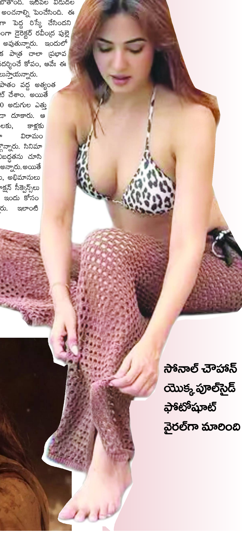
సోనాల్ చౌహాన్ యొక్క పూల్ సైడ్ ఫోటో షూట్ వైరల్ గా మారింది

వరల్డ్ ఫుల్ పాత్రలో కనిపించబోతోంది. ఇటీవల విడుదల చేసిన టైటిల్ గ్రింప్స్ సినిమాపై అంచనాల్ని పెంచేసింది. ఈ సినిమా కోసం రిస్కేక్ తాజాగా పెద్ద రిస్కో చేసిందని తెలిసింది. ఆ విషయాన్ని స్వయంగా డైరెక్టర్ రవీంద్ర పుల్లె వెల్లడించడంతో అంతా షాక్ అవుతున్నారు. ఇందులో టైటిల్ పాత్ర పోషిస్తున్న రిస్కేక్ పాత్ర చాలా ప్రభావ వంతంగా ఉంటుందని, ఆమె ప్రదర్శించే కోపం, ఆవే ఈ సినిమాకు ప్రధాన హైలైట్ గా నిలుస్తాయన్నారు. ఇటీవల కేరళలోని అతిర జలపాతం వద్ద అత్యంత క్లిష్టమైన ఓ యాక్షన్ సిన్ ను మాట్ చేశాం. అయితే ఈ సన్నివేశం కోసం రిస్కేక్ 80 అడుగుల ఎత్తు నుంచి ఎలాంటి డూప్ లేకుండా దూకారు. ఆ సమయంలో ఆమె చేతులకు, కాళ్లకు గాయాలయ్యాయి. అయినా విరామం తీసుకోకుండా షూటింగ్ లో పాల్గొన్నారు. సినిమా పట్ల, నటన పట్ల ఆమెకున్న నిబద్ధతను చూసి టీమ్ అంతా ఆశ్చర్యపోయాం- అన్నారు. అయితే ఈ విషయం తెలిసిన నెటిజన్లు, అభిమానులు మాత్రం స్టార్ హీరోలే రిస్కో యాక్షన్ సిక్వెన్స్ లు చేయడానికి భయపడుతున్నారు. ఇందు కోసం బాడీ డబుల్స్ ని వాడేస్తున్నారు. ఇలాంటి నేపథ్యంలో ఎలాంటి డూప్ లేకుండా ఇలా రిస్కోలు చేయడం అవసరమా? అని వాపోతున్నారు. 80 అడుగుల ఎత్తులో నుంచి దూకడం అనేది కరెక్ట్ కాదని, ఇకపై అలాంటి రిస్కోలకు దూరంగా ఉండాలని సూచిస్తున్నారు.