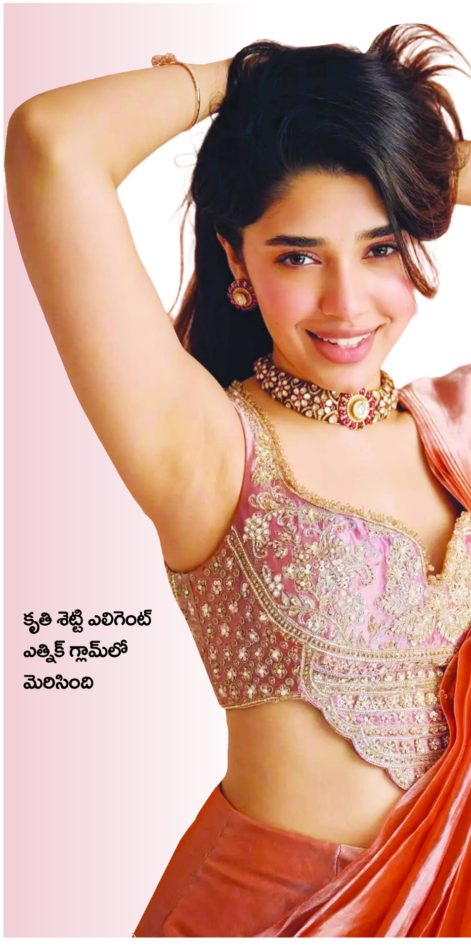
కృతి శెట్టి ఎలిగెంట్ ఎత్తిక్ గ్లామ్ లో మెరిసింది

రికార్డు సృష్టించాడు. ఒక ఇన్నింగ్స్ లో 33 ఫోర్లు, 9 సిక్సర్లతో విరుచుకుపడి.. ఈ మైలరాన్ని చేరుకోవడం ప్రస్తుత తరం ప్లేయర్స్ కి ఒక కలగానే మిగిలిపోయింది. ఇంటర్నేషనల్ క్రికెట్ లో సిక్సర్ల రాజు: సిక్సర్లు బాదడంలో రోహిత్ శర్మకు సాటి ఎవరూ రాలేదు.. క్రికెట్ 3 ఫార్మాట్లలో కలిపి మొత్తం 650కి పైగా సిక్సర్లు బాది వరల్డ్ లోనే అగ్రస్థానంలో నిలిచాడు. వెస్టిండీస్ దిగ్గజం క్రిస్ గేల్ పేరుపై ఉన్న ఘనతని తుడిచి పెట్టిన హిట్ మ్యాన్, తన అద్భుతమైన టైమింగ్ తో సిక్స్ మెషిన్ గా గుర్తింపు తెచ్చుకున్నాడు.