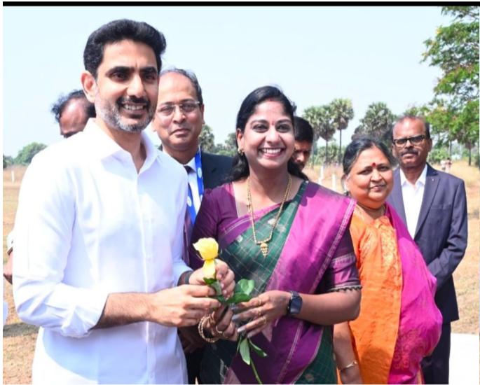
మంత్రి నారా లోకేశ్ సేవలను ఎమ్మెల్యే కొనియాడారు.