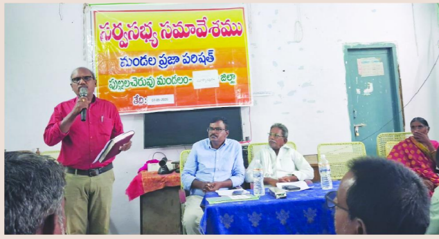
పుల్ల చెరువు పెన్ పవర్ మే 7