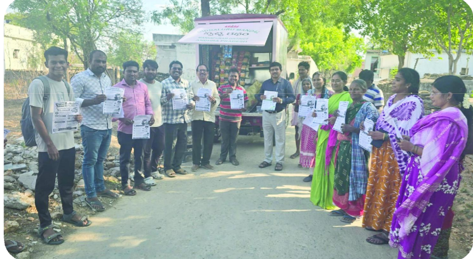
గిద్దలూరు పెన్ పవర్ మే 7