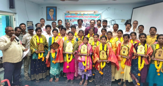
సాధించడం ద్వారా విద్యార్థుల్లో ఉన్నత లక్ష్యాలను చేరుకునే దైర్ఘ్యం పెరుగుతుంది, విద్యార్థులందరూ ఇదే పట్టుదలతో చదివి ఉన్నత శిఖరాలను అధిరోహించాలని, సమాజానికి ఉపయోగపడే పౌరులుగా ఎదగాలని ఆకాంక్షించారు. చదువే సంపదన సమృద్ధి, క్రమశిక్షణతో చదివిన విద్యార్థులు అలమూరు మండలానికి మంచి పేరు తెచ్చారని అన్నారు. రాజోయే రోజుల్లో వీరికి ప్రభుత్వం తరఫున మంచి ప్రోత్సాహం ఉంటుందని భరోసా ఇచ్చారు. రాష్ట్ర ప్రభుత్వం అమలు చేసిన 100 రోజుల కార్యచరణ ప్రణాళిక వల్ల విద్యార్థుల విద్యాభివృద్ధి ప్రత్యేక దృష్టి సారీస్తూ మెరుగైన ఫలితాలు సాధించగలిగారని తెలిపారు. ఈ సందర్భంగా కూటమి నాయకులు మాట్లాడుతూ ప్రభుత్వ పాఠశాల విద్యార్థులు అసాధారణ ప్రతిభ కనబరచడం చాలా గర్వకారణమని, విద్యార్థులు సాధించిన ఈ