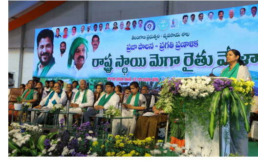
- రైతు సంక్షేమం నుండి ఆదాయ పెరుగుదల దిశగా ప్రభుత్వం అడుగు