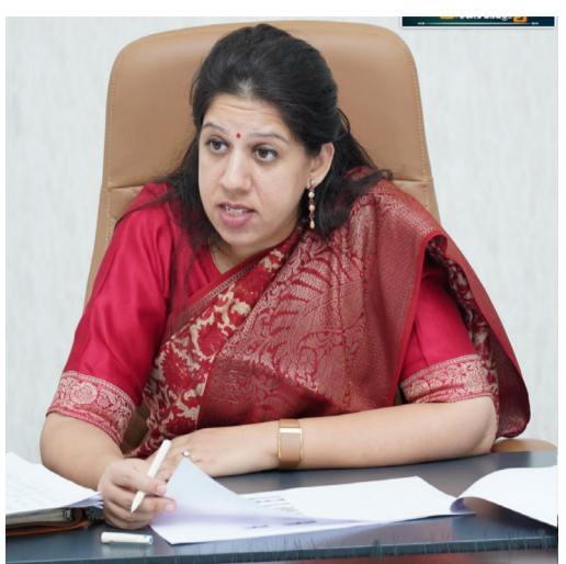
పోలీసులకు సమాచారం అందించాలని జిల్లా కలెక్టర్ విజ్ఞప్తి చేశారు.