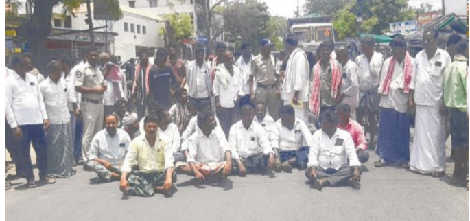
తిరస్కరించారు. అంటే నాగానికి పైగా బేజ్లను వెనక్కు పంపారు. రైతులు దిక్కుతోపని స్థితిలో మళ్లీ వాటిని వెనక్కి తీసుకువెళ్లారు. గరిష్ట ధర రూ.250 కాగా నగలు ధర రూ.233.68 పలికింది. ఎన్ఎల్ఎస్లో 2121 బేజ్లకు రూగా 1470 బేజ్లను కొనుగోలు చేశారు. 651 బేజ్లను వెనక్కు పంపారు. ఇక్కడా 30.69 శాతం తిరస్కరణకు గురైంది. గతేడాది ఆఖరులో కిలో పొగాకు ధర రూ.300 దాటి పలికింది. ప్రస్తుతం రూ.250కు మించి పెరగలేదు. వ్యాపారులకు పోటీగా గతంలో మారీగా కొనుగోలు చేయాలని అప్పడే సీలింగు ధర బద్దలవుతుందని రైతులు చెబుతున్నారు.

ఓంగోలు: పెన్ పవర్ మే 7. పొగాకు మార్కెట్ రోజురోజుకూ పతనం దిశగా సాగుతోంది. గురువారం ఎన్ఐఎస్ పరిధిలోని వేలం కేంద్రాల్లో 57.12 శాతం బేజ్లను వివిధ కారణాలతో తిరస్కరించారు. బోర్డు అధికారులు వాటిని కొనుగోలు చేయించేందుకు ఎటువంటి ప్రయత్నాలు చేయలేదు. వేలం తీరుపై విసుగెత్తిన కర్షకులు వేలం బహిష్కరించి ఓంగోలు-కర్నూలు రోడ్డుపై ఖైదయ్యారు. గిట్టుబాటు ధరలు కల్పించాలని ఆందోళన చేపట్టారు. కిలో పొగాకు రూ.250 కాగా నగలు ధర రూ.360కు కొనుగోలు చేయాలని రైతులు డిమాండ్ చేశారు. గురువారం నాటి కొనుగోళ్లను పరిశీలిస్తే ఎన్ఐఎస్లో 1495 బేజ్లకు రూగా 641 బేజ్లను కొనుగోలు చేశారు. 854 బేజ్లను