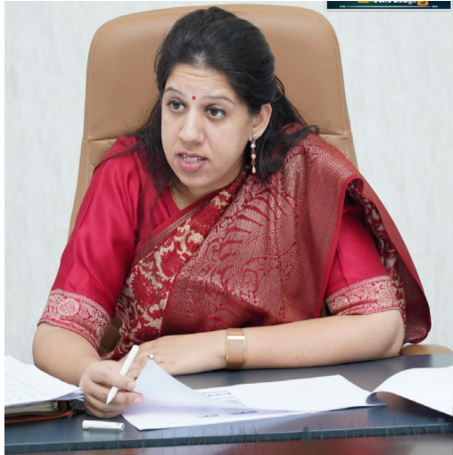
పోలీసులకు సమాచారం అందించాలని జిల్లా కలెక్టర్ విజ్ఞప్తి చేశారు.