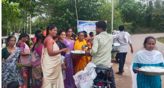
మానవ సేవే మార్గం సేవ అనే భావనతో ముందుకు వెళ్తున్న దారేల గ్రామ ప్రజలకు పలువురు అభినందనలు తెలిపారు. ఈ సేవా కార్యక్రమాలు వేసవిలో ప్రజలకు ఎంతో ఉపశమనాన్ని కలిగిస్తున్నాయి.

ముంచంగిపట్టు, పెన్ పవర్, మే 09.వేసవికాలం కావడంతో ఎండ తీవ్రత ఎక్కువగా ఉండటం వల్ల బాటసారులు దాహంతో అలమటిం చే పరిస్థితులు రాకుండా బాటసారుల దాహార్తిని తీర్చిన మహిళలు సేవా గుణం అనేకులకు ఆదర్శం. వివరాల్లోకి వెళ్తే... అల్లూరి జిల్లా, ముంచంగిపట్టు మండలంలోని దారేల గ్రామ పెద్దలు, మహిళలు కిలగడ కూడలి వద్ద సమీపంగా గ్రామస్థులు వారికి తోచినంత చందాలు పోగు చేసుకుని, కొందరు దాతల సహాయంతో పాలు, ఇటుకల పండుగ సందర్భంగా గిరిజన సంప్రదాయమైన పజీరు ద్వారా వచ్చిన నిధులతో చలివేంద్రం ఏర్పాటు చేశారు. చలివేంద్రం నిర్వహణలో మహిళలు గ్రామస్థులు చురుకుగా పాల్గొంటూ ప్రయాణికులకు చల్లని మజ్జిగ అందిస్తూ దాహార్తిని తీర్చడమే కాకుండా పులిహోర ప్రసాదం అందించారు. తీవ్ర ఎండ వేడిలో వారి దాహం తీర్చడం నిజంగా గొప్ప సేవా కార్యక్రమమని పలువురు కొనియాడారు.