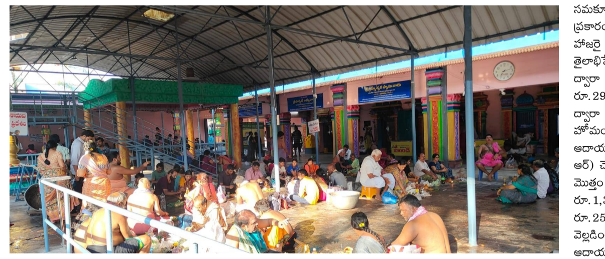
కొత్తపేట, పెన్ పవర్, మే 9: కొత్తపేట మండలం మందపల్లి గ్రామంలోని శ్రీ మందేశ్వర స్వామి దేవస్థానంలో శనివారం నిర్వహించిన తైలాభిషేకాలు, ప్రత్యేక పూజలు, భక్తుల విరాళాల ద్వారా భారీ ఆదాయం సమకూరింది. దేవస్థానం అధికారులు వెల్లడించిన వివరాల ప్రకారం దినసరి పూజా కార్యక్రమాలకు భక్తులు విశేషంగా హాజరై స్వామివారిని దర్శించుకున్నారు. ముఖ్యమండపం తైలాభిషేకం ద్వారా రూ.14,000, ఏకాదశ రుద్ర తైలాభిషేకం ద్వారా రూ.51,500, మహాన్యాయ పూర్వక తైలాభిషేకం ద్వారా రూ.29,400 ఆదాయం లభించింది. తైలం సమర్పించి దర్శనం ద్వారా రూ.13,200, తిలదానం ద్వారా రూ.200, స్వయం హోమం ద్వారా రూ.1,600, కేశఖండన ద్వారా రూ.120 ఆదాయం వచ్చినట్లు తెలిపారు. అదేవిధంగా పి.ఓ.యస్ (కూకా ఆర్) చెల్లింపుల ద్వారా రూ.19,060, ప్రత్యక్ష పూజల ద్వారా మొత్తం రూ.1,29,080, పరోక్ష పూజల ద్వారా రూ.1,33,900, అన్నప్రసాదం విరాళాల రూపంలో రూ.25,750 ఆదాయం వచ్చినట్లు అధికారులు వెల్లడించారు. మొత్తం కలిపి దేవస్థానానికి రూ.2,88,730 ఆదాయం సమకూరినట్లు తెలిపారు.