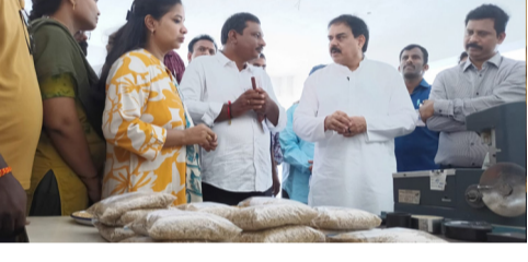
ఉంటున్నారు. ఎక్కడ ఏ సమస్య వచ్చినా వెంటనే పరిష్కరించేలా యంత్రాంగం పనిచేస్తోంది. దీనిని ఎప్పటికప్పుడు ప్రధాన కార్యాలయం నుంచి పర్యవేక్షించేందుకు ప్రత్యేక బృందం పనిచేస్తుంది.

విజయవాడ, పెన్ పవర్, మే, 09, రాష్ట్ర వ్యాప్తంగా రైతాంగ ప్రయోజనం కోసం కేంద్ర ప్రభుత్వం మొదటి సారి బాయిల్డ్ రైస్ కొనుగోలుకు అనుమతి ఇచ్చింది. దీని ద్వారా రాష్ట్రంలో చేదాది మంది రైతులకు మేలు జరుగుతుంది అని రాష్ట్ర ఆహార పౌరసరఫరాల శాఖ మంత్రి నాదెండ్ల మనోహర్ స్పష్టం చేశారు. ఈ ఏడాది రబీలో సుమారు 2 లక్షల మెట్రిక్ టన్నుల బాయిల్డ్ రైస్ ను తీసుకుంటామని చెప్పారు. రబీ ధాన్యం సేకరణ క్షేత్రస్థాయిలో జరుగుతున్న తీరును పరిశీలించేందుకు శనివారం ఎన్టీఆర్ జిల్లాలోని రామవరప్పాడు మిశాల సహకార పరపతి సంఘం లిమిటెడ్ కార్యాలయం, గొల్లపూడి ఆర్ఎన్ కే కేంద్రాలను మంత్రి పర్యటించి సందర్శించారు. అక్కడ ధాన్యం నుంచి తేమ శాతం పరిశీలించే విధానాన్ని స్వయంగా పరిశీలించారు. అనంతరం రైతులతో మచ్చలించారు. క్షేత్రస్థాయిలో ఎదురవుతున్న సమస్యలను, ఇబ్బందులను అడిగి తెలుసుకున్నారు. ఈ సందర్భంగా ధాన్యం అమ్మిన తర్వాత 30 నిమిషాల నుంచి 17 గంటల వ్యవధి లోనే నగదు తమ బ్యాంకు ఖాతాల్లో జమ అవుతుందని రైతులు మంత్రి ఎదుట సంతోషం వ్యక్తం చేశారు. ఇక్కడ క్షేత్రస్థాయిలో కొన్ని సమస్యలు గుర్తించారు. తేమ శాతం ఎక్కువగా ఉండడం, గోతాలకు రంధ్రాలు ఉండడం గుర్తించారు. రైతులకు ఇబ్బందులు లేకుండా సకాలంలో లాబీలు, కోతలు అందుబాటులో ఉంచాలని అధికారులను ఆదేశించారు. ధాన్యంలో తేమ శాతం తనిఖీ యంత్రాలు పూర్తిగా బ్యూటామ్ తో మాత్రమే వాడాలని సూచించారు. రైతులకు ప్రభుత్వం అందగా ఉంటుందని భరోసా ఇచ్చారు. రైతులు చెప్పిన సమస్యలు అక్కడే నోట్ చేసుకుని, ముస్తాబాద్, కొండూరు ఆర్ఎన్కే కేంద్రాలకు ఫోన్ చేసి సాయంత్రం తోపు సమస్యలను పరిష్కరించాలని ఆదేశించారు. ఈ సందర్భంగా మీడియాతో నాదెండ్ల మనోహర్ మాట్లాడుతూ..