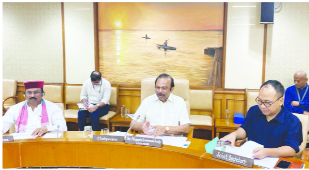
రోపొందించడం, పట్టణ, దేశ ప్రణాళిక సంస్థ పాత్ర, పనితీరు అంశాలపై చర్చలు జరిపారు.