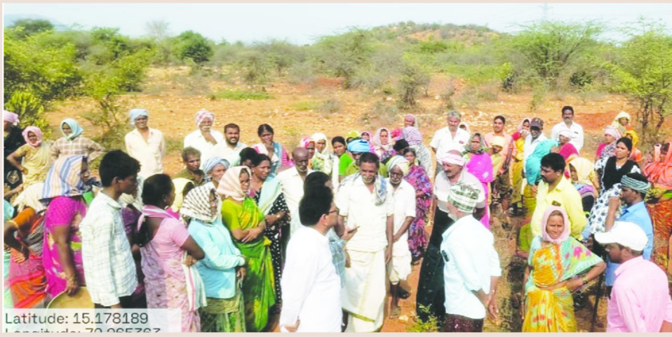
Latitude: 15.178189 Longitude: 79.085727