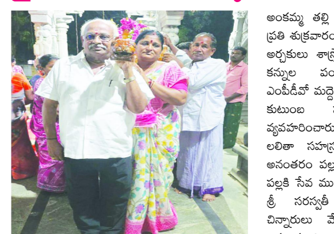
కందుకూరు పెన్ పవర్, మే 22 కందుకూరు గ్రామదేవత ఆదిపరాశక్తి శ్రీ శ్రీ