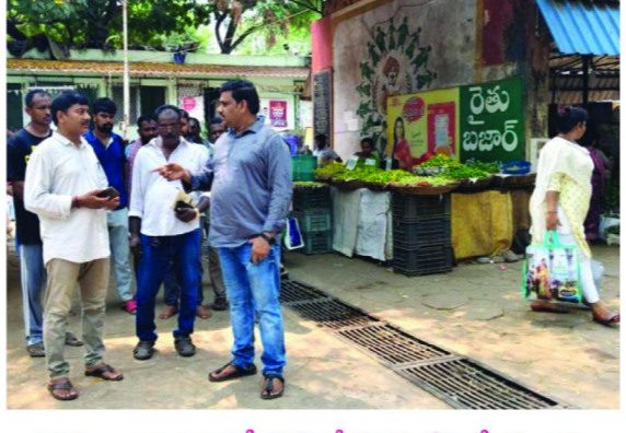
రైతులు, ద్వారాలలో సమావేశమైన ప్రాంతీయ ఉప సంచాలకులు

వినియోగదారుల మరియు వ్యాపారులకు అనుకూల వాతావరణం కల్పించేందుకు అవసరమైన చర్యలు తీసుకుంటామని హామీ ఇచ్చారు. రైతు బజార్లో ప్రధానంగా పాపింకి సమస్య తీవ్రంగా ఉన్నట్లు గుర్తించిన ఆయన, పాపింకి నిర్వహణను సక్రమంగా చేపట్టాలని గుత్తదారునికి స్పష్టమైన ఆదేశాలు జారీ చేశారు. వాహనాలు అడ్డంకులు లేకుండా నిలిపే విధంగా పాపింకిను పునర్వ్యవస్థీకరించాలని సూచించారు. వినియోగదారులకు ఎటువంటి అసౌకర్యం కలగకుండా చర్యలు తీసుకోవాలని పేర్కొన్నారు. అలాగే రైతుల స్టాల్స్ నిర్వహణ, ఆర్కెస్ షాంట్ పనితీరు, రైతు బజార్లో ఏర్పాటు చేసిన చలివేండ్రం, మరుగుదొడ్లు, వర్షి కంపోస్ట్ యూనిట్లను పరిశీలించారు. సౌకర్యాల నిర్వహణలో నిర్లక్ష్యం ఉండకూడదని అధికారులకు సూచించారు. ముఖ్యంగా వేసవి కాలాన్ని దృష్టిలో ఉంచుకుని తాగునీటి సదుపాయాలు ఎప్పటికప్పుడు అందుబాటులో ఉండాలని ఆదేశించారు. రైతు బజార్లో ప్రధాన ధరల పట్టిక వినియోగదారులకు స్పష్టంగా కనిపించేలా పెయింటింగ్ చేపట్టేందుకు అంచనాలు సిద్ధం చేయాలని అధికారులను ఆదేశించారు. ధరల వివరాలు పారదర్శకంగా ఉండడం పట్ల వినియోగదారులకు మేలు జరుగుతుందని తెలిపారు. చివరగా రైతు బజార్లో ఎటువంటి సమస్యలు ఉన్నా నేరుగా తన దృష్టికి తీసుకురావాలని రైతులు, ద్వారా సభ్యులు, వినియోగదారులకు సూచించారు. రైతు బజార్ను ప్రజలకు మరింత ఉపయోగకరంగా తీర్చిదిద్దేందుకు శాఖ కట్టుబడి పనిచేస్తుందని ఆయన పేర్కొన్నారు.