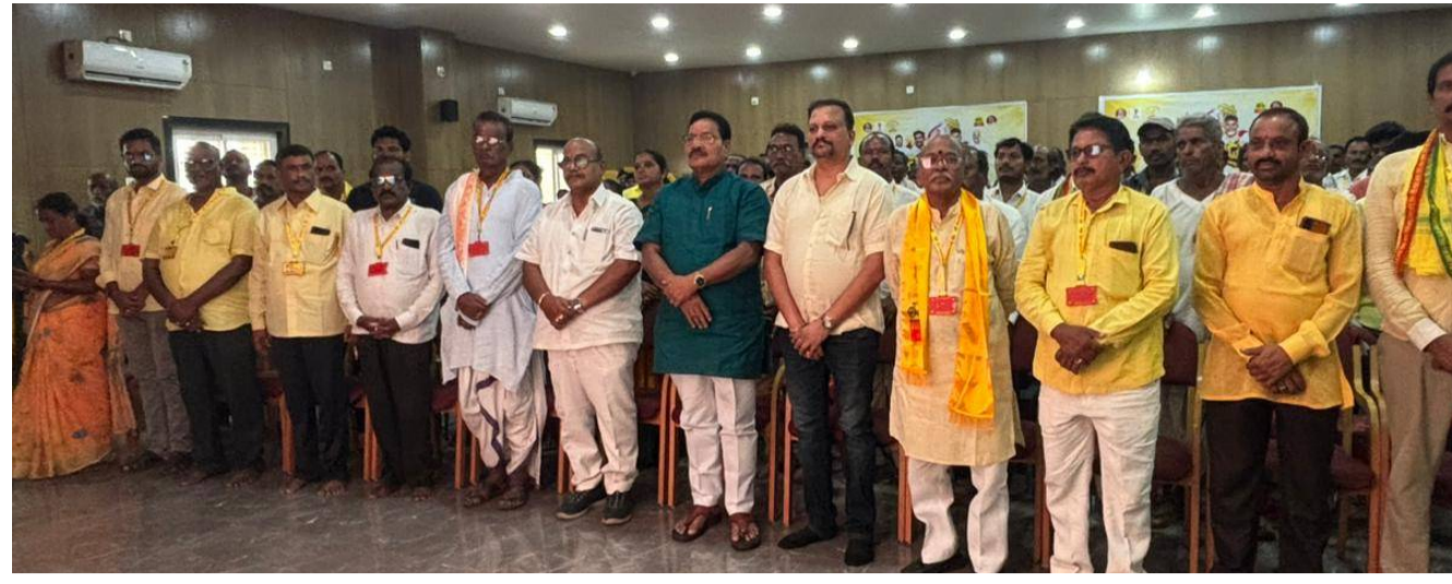
మంత్రి అచ్చన్న పిలుపుతో కడం తొక్కిన పనుపు సైన్యం చంద్రబాబు, లోకేష్ ప్రసంగాలతో కార్యక్రమంలో నూతనోత్సాహం

టెక్నాలి, పెన్ పవర్ మే 27 : రాష్ట్ర వ్యవసాయ శాఖ మంత్రి కింజరాపు అచ్చన్నాయుడు పిలుపుతో టెక్నాలి నియోజకవర్గంలో టీడీపీ పార్టీ శ్రేణులు భారీగా తరలివచ్చారు. నియోజకవర్గ పరిధి లోని నాలుగు మండలాల పరిధిలో 10 క్షేత్రాల్లో డిజిటల్ విధానంలో పనుపు సైన్యం నిర్వహించిన 'మహానాడు' కార్యక్రమం ఘనంగా జరిగింది.