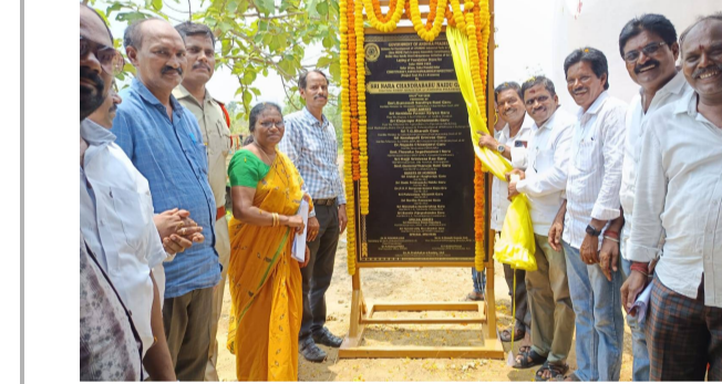
సాలూరు : పెన్ పవర్, మే 27. ఆంధ్రప్రదేశ్ రాష్ట్రం మొత్తం మీద ఈరోజు మహానాడు ఎంతో అట్టహాసంగా ప్రారంభమైంది. అందులో

టాన్ ప్రెసిడెంట్ నిమ్మది.చిట్టి అధ్యక్షులలో మంత్రి క్యాంప్ కార్యాలయంలో మహానాడు కార్యక్రమం