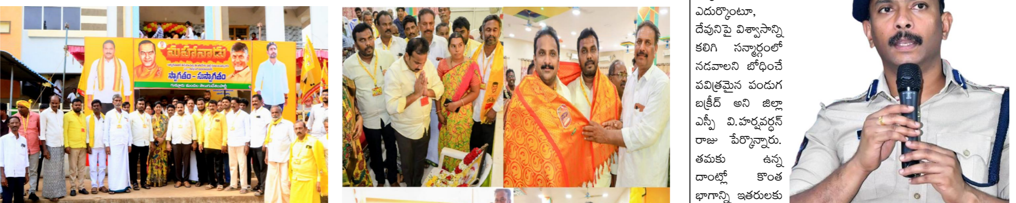
గుడ్లూరు, పెన్ పవర్, మే 27:

మహానాడు ప్రాముఖ్యతను వివరించిన ఎమ్మెల్యే ఇంటూరి