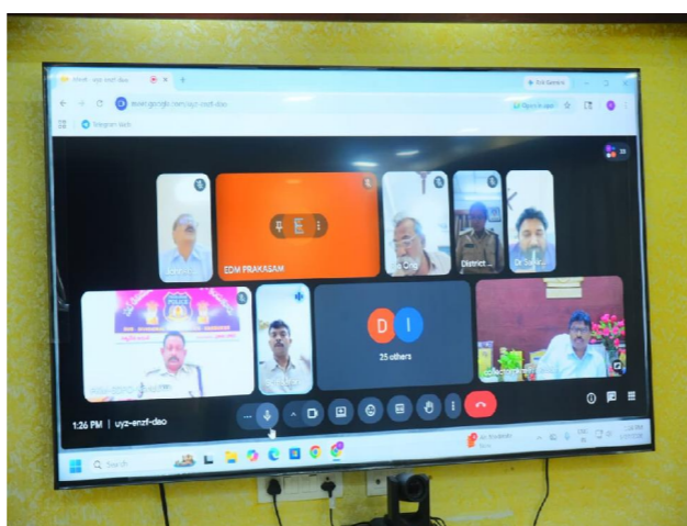
స్టాఫ్ రిపోర్టర్ పెన్ పవర్, ఒంగోలు మే 27