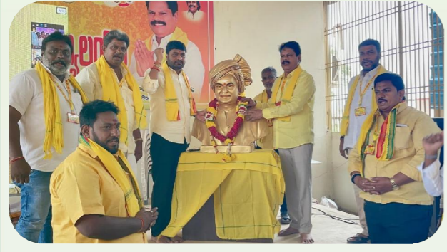
ఆర్ సి ఇంచార్జి యర్రగండపాలెం పెన్ పవర్ మే 27