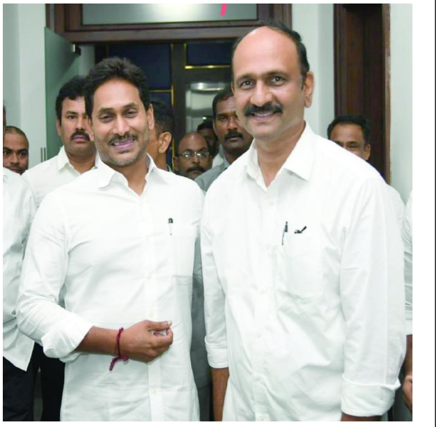
గిద్దలూరు పెన్ పవర్ మే 27