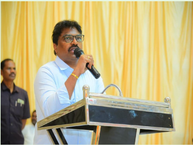
స్టాఫ్ రిపోర్టర్ పెన్ పవర్, ఒంగోలు మే 27

గ్రామీణ ప్రాంతాల్లో పారిశుధ్య నిర్వహణ పటిష్టంగా నిర్వహించడంలో పంచాయతీ రాజ్ శాఖ అధికారులు ప్రత్యేక దృష్టి సారించాలని జిల్లా కలెక్టర్ శ్రీ పి. రాజాబాబు, పేర్కొన్నారు. బుధవారం ఒంగోలు నగరంలోని ఎస్పిఎస్ ఫంక్షన్ హాల్లో ప్రకాశం, మార్కాపురం, బాపట్ల జిల్లాలకు చెందిన పంచాయతీ రాజ్ శాఖ అధికారులకు నిర్వహించిన ఘన వ్యూహ నిర్వహణ నియమాల అమలు, గ్రామ పంచాయతీలలో ఘన వ్యూహ శుద్ధి కేంద్రాల కార్యచరణ పై పంచాయతీ రాజ్ శాఖ అధికారులకు నిర్వహించిన వర్క్ షాప్ లో జిల్లా కలెక్టర్ రాజాబాబు పాల్గొని ప్రసంగిస్తూ, ఆంధ్రప్రదేశ్ రాష్ట్రాన్ని క్షీణిం ఆంధ్రప్రదేశ్ గా మార్చాలన్న లక్ష్యంతో రాష్ట్ర ముఖ్యమంత్రి అధికారులతో ఎప్పటికప్పుడు సమీక్షిస్తూ అనేక కార్యక్రమాలను అమలు చేయడం జరుగుచున్నదన్నారు.