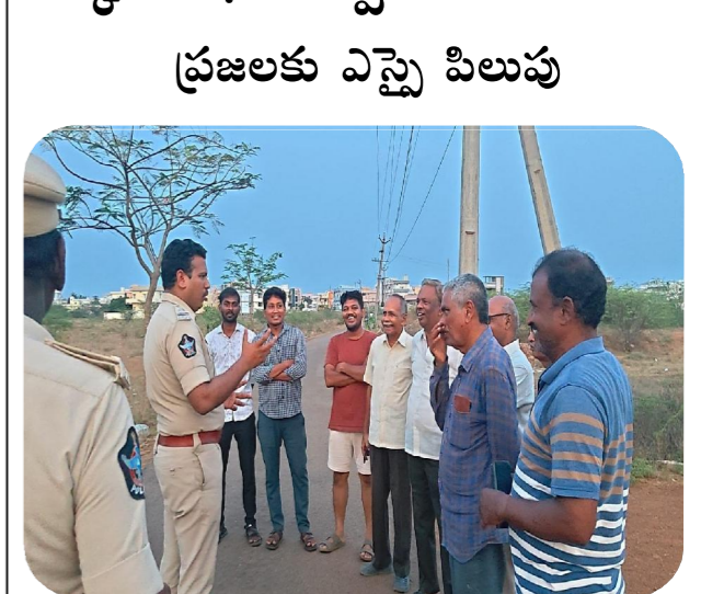
సింగరాయకొండ, మే 27, పెన్ పవర్