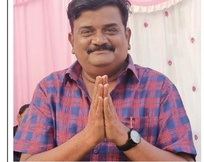
సి ఎస్ పురం, పెన్ పవర్ మే 27

ముస్లిం సోదరులకు షేక్ బడే నాయిబ్ రసూల్ శుభాకాంక్షలు