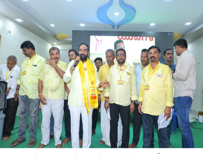
నిలిచిన వ్యక్తి ఎన్టీఆర్ అని గుర్తు చేశారు. సినీ రంగంలోనే కాక, రాజకీయ రంగంలోనూ తనదైన ముద్ర వేసుకుని, తెలుగు వారి ఆత్మ గౌరవాన్ని ప్రపంచానికి చాటిన మహోన్నతమైన ఆశయాలున్న వ్యక్తి రామారావు అని కొనియాడారు. ఈ కార్యక్రమంలో తెలుగుదేశం పార్టీ నాయకులు, కార్యకర్తలు తదితరులు పాల్గొన్నారు.