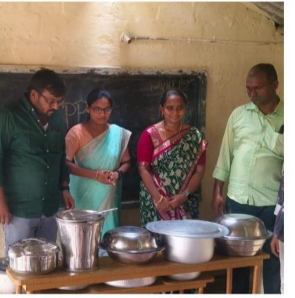
ఇశ్రాయేలు, బీరది ఇరుమియా, బంగారుపాలెం ఎం ఈ ఓ పులి నాగేశ్వరావు, బిరుదు నాగేశ్వరావు పోలీస్ కానిస్టేబుల్, బిరుదు ధ్యాన్సండ్, కడియం లావణ్య మనవలు, మనవరండ్లు పాల్గొన్నారు.