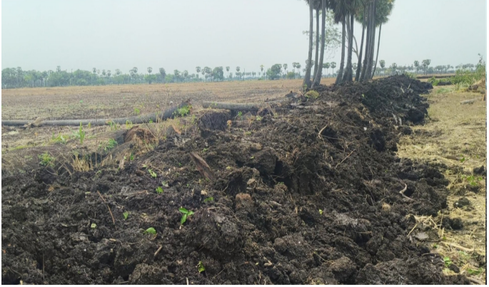
విధానాలను అడిగి తెలుసుకున్నారు. ఇది కేవలం ఆక్రమణ కాదని దాదాపు 100 మంది రైతులకు ఉపయోగపడేవిధిని ఉన్నతాధికారుల దృష్టికి ఈ విషయాన్ని తీసుకువెళ్తున్నారు.

పెదన, మే 28, పెన్ పవర్ ప్రతినిధి నియోజకవర్గ పరిధిలోని గూడూరు మండలం ముక్కోట్ల గ్రామంలో ఏళ్ల తరబడి నిరుత్సాహం ఎదురుచూస్తున్న రైతులు సమస్య త్వరలోనే చేరునుంది. అదే గ్రామంలోని దేవాదాయ ధర్మాదాయ శాఖ భూములకు చెందిన డొంక గతంలో అన్యకాంతమయ్యింది. ఈ నేపథ్యంలో ఇదే దారి మీదుగా 150 నుంచి 160 ఎకరాల విస్తీర్ణంలో వ్యవసాయం సాగు అవుతుంది. అయితే దిగువ రైతులు ధాన్యం ఎరువులు పురుగు మందులు కూలిలు చేరాంటే గట్ట పైన నడవాలింది. ఈ వివరంపై రైతన్నలు ఇటీవల జరిగిన స్పందన కార్యక్రమంలో ఎమ్మెల్యే కాకత కృష్ణ ప్రసాద్ కు విన్నవించారు. దీనిపై ఆయన స్పందిస్తూ ఇది రైతన్నల ప్రభుత్వం అని ఎలాంటి సమస్యలైనా తీర్చేందుకు కూటమి ప్రభుత్వం ముందుంటుందని భరోసా ఇచ్చారు ఈ నేపథ్యంలో గతంలో అన్యకాంతమైన దేవతాయ ధర్మాదాయ శాఖ భూముల డొంకను పునరావృతం చేశారు. దీనిపై రైతన్నలు హర్షం వ్యక్తం చేస్తున్నారు. ఇదలా ఉండగా సంబంధిత భూముల ఈచో ఉదయగిరి జయశ్రీహ్ గురువారం పరిశీలించారు. రైతులకు ఉపయోగపడే విధి