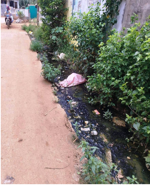
ఏలూరు మే 31 పెన్ పవర్ : ద్వారకా తిరుమల మండలంలోని తిరుమలం పాలెం గ్రామంలో పారిశుధ్య నిర్వహణ అస్తవ్యస్తంగా

మారింది.విధిగా పారిశుధ్య నిర్వహణ చేపట్టాల్సిన అధికారులు అలసత్వం వహిస్తుండడంతో ప్రజలు తీవ్ర ఇబ్బందులు ఎదుర్కొంటున్నారు.పారిశుధ్య నిర్వహణ క్షేత్ర స్థాయిలో అధికారుల పర్యవేక్షణ చేపట్టకపోవడంతో మండలంలో శివారు గ్రామమైన తిరుమలం పాలెంలో పారిశుధ్య నిర్వహణ సక్రమంగా జరగడం లేదని విమర్శలు వస్తున్నాయి