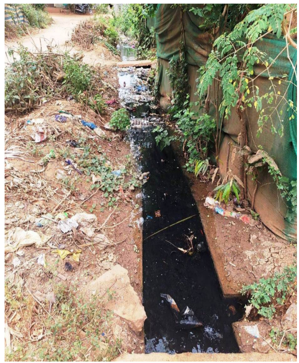
దోమల బెడదతో సతమతం