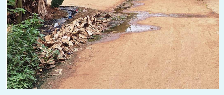
* తిరుమలంపాలెం గ్రామంలో నెల రోజులుగా సమస్య