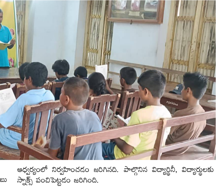
అధ్యక్షులలో నిర్వహించడం జరిగినది. పాల్గొనిన విద్యార్థిని, విద్యార్థులకు స్పాక్స్ పంపిణీకడం జరిగింది.

ప్రతిపాదించారు. అని తెలియజేశారు. అనంతరం నారం తెల్లీ ఉమామహేశ్వరరావు రచించిన తెలివైనవాడు పుస్తకం నుండి చదువు బాధ్యత- అనవసరం ఆందోళన అనే కథలను విద్యార్థులచే చదివించడం, కథలు చెప్పించడం, పుస్తక పఠనం చేయించడం జరిగినది. తరువాత విద్యార్థిని, విద్యార్థులకు ఇండోర్ గేమ్స్ క్వారమ్స్-చేస్ ఆటలపై అవగాహన కల్పించి, నేర్పించి, ఆడించడం జరిగినది. ఈ కార్యక్రమంలో గ్రంథాలయం నిర్వహించి, పాఠకులు, 13 మంది విద్యార్థిని, విద్యార్థులు పాల్గొన్నారు. గ్రంథాలయాధికారి జాన్ బాబు