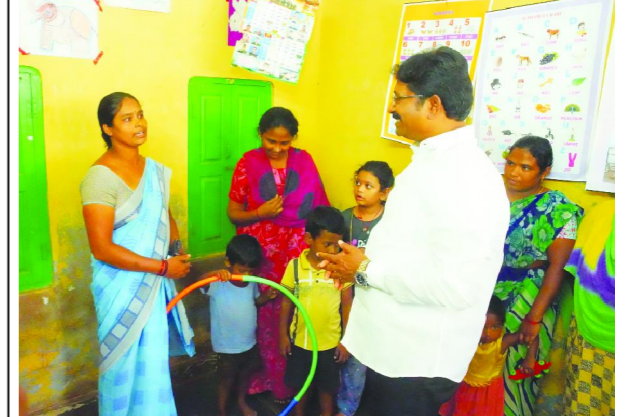
గిద్దలూరు పెన్ పవర్ జూన్ 1