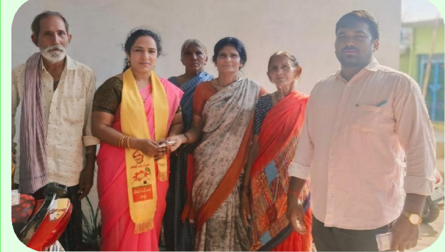
కొమరోలు పెన్ పవర్ జూన్ 1