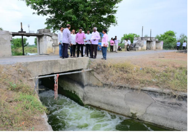
బ్యారో పెన్ పవర్, ప్రకాశం జూన్ 01

-అధికారుల నిరంతర పర్యవేక్షణ అవసరం -జిల్లా కలెక్టర్ రాజాబాబు