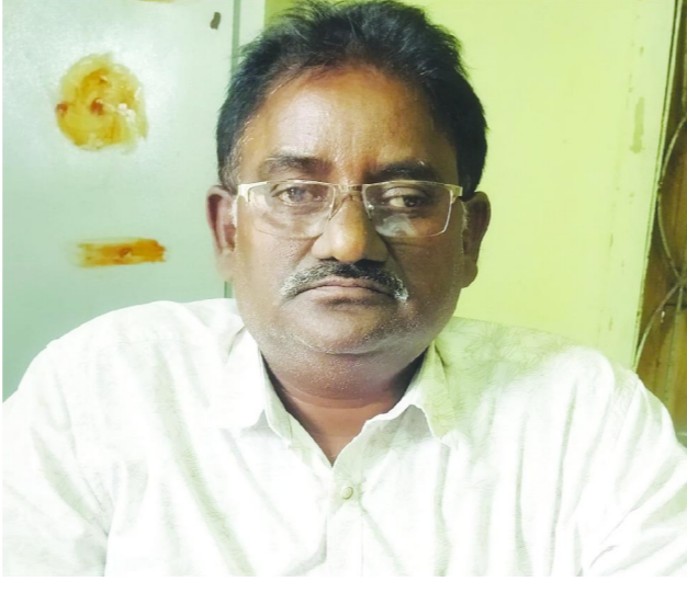
కొమరోలు పెన్ పవర్ జూన్ 1.