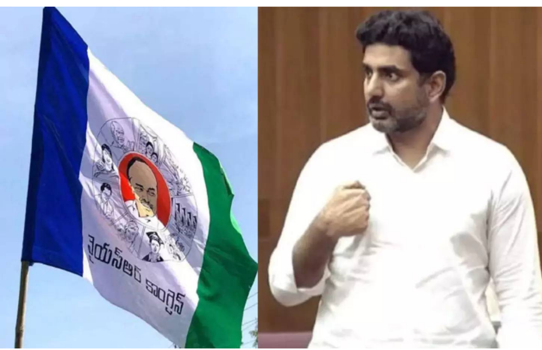
వైసీపీ బిగ్ షాన్

వస్తే కొండ.. పోతే ఈక.. అన్నట్లు ఆలోచనతో ఉంది వైయస్సార్ కాంగ్రెస్ పార్టీ. మోగ డీఎస్సీ 2025 పై భారీగానే షాన్ చేసింది ఆ పార్టీ. ఏడాది తరువాత అక్రమాలు జరిగాయి అంటూ ఆరోపణలు చేస్తోంది. కేవలం ఆరోపణలకు మాత్రమే పరిమితం అవుతోంది. ఎక్కడ న్యాయపోరాటం చేయడం లేదు. దీని వెనుక వైయస్సార్ కాంగ్రెస్ పార్టీ పక్కా స్ట్రాటజీ అవుతోంది. కేవలం రాష్ట్రంలో లక్షలాది ఓట్లను టార్గెట్ చేసుకునే ఈ కొత్త ప్రచారానికి తెర తీసింది. పోతే వేల ఓట్లు.. వస్తే లక్షల కోట్లు అన్నట్లు ఆలోచన చేసింది. గట్టిగానే ప్రణాళిక చేసింది. రాష్ట్రవ్యాప్తంగా ఆందోళనలు చేస్తోంది. సాక్షి మీడియాలో వ్యతిరేక కథనాలు వచ్చిస్తోంది.వైయస్సార్ కాంగ్రెస్ పార్టీ హయాంలో ఒక్క ఉపాధ్యాయ పోస్ట్ కూడా భర్తీ చేయలేదు. కనీసం అటువంటి ఆలోచన చేయలేదు. అధికారంలోకి వస్తే ఏటా మోగ డీఎస్సీ ప్రకటిస్తామని 2019 ఎన్నికల్లో హామీ ఇచ్చారు జగన్. దీంతో రాష్ట్ర వ్యాప్తంగా ఉపాధ్యాయ శిక్షణ పొందిన లక్షలాదిమంది అశకం అవుతున్నారు. కానీ వారికి అవకాశం ఇవ్వలేదు జగన్. 2024 ఎన్నికలకు నెల రోజుల ముందు 6100 ఉపాధ్యాయ పోస్టులతో డీఎస్సీ నోటిఫికేషన్ ఇచ్చారు. రంధంలోనే ఎన్నికల లక్ష్యాదిమందికి ఎదురుచూపులు మిగిలిపోయాయికూటమి అధికారంలోకి వచ్చిన వెంటనే మోగ డీఎస్సీ ఫైల్ పై సంతకం చేశారు సీఎం చంద్రబాబు. నారా లోకేష్ నేతృత్వంలో డీఎస్సీ నియామక ప్రక్రియ గడుపుతోగా పూర్తి చేయగలిగారు. గత ఏడాది ఉపాధ్యాయులను నియామించారు. అయితే కూటమికి అదే షన్ పామంటే గా మారింది. ఉపాధ్యాయ వర్గాల్లో కూడా