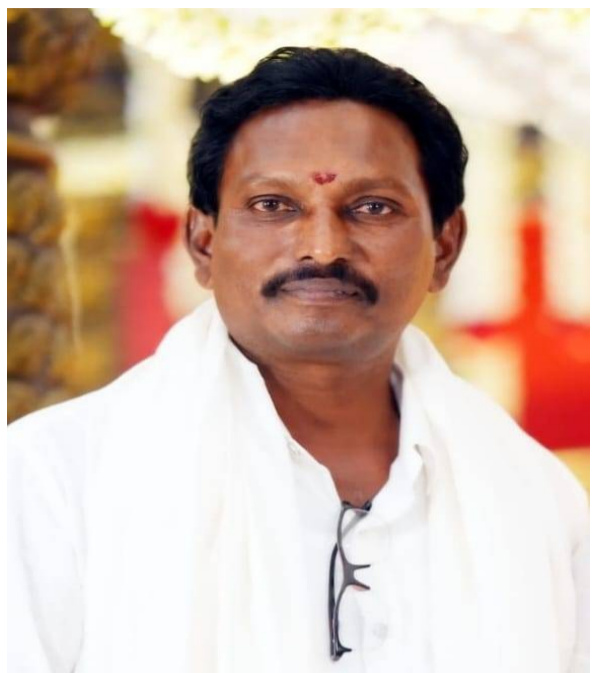
అలమూరు, పెన్ పవర్, జూన్ 02:కొత్తపేట నియోజకవర్గం అలమూరు మండలం మడికి శ్రీ అభయ ఆంజనేయ స్వామి రైతు అంతర్జాతీయ కూరగాయల మార్కెట్ కార్యవర్గ సూతన అధ్యక్షుడిగా