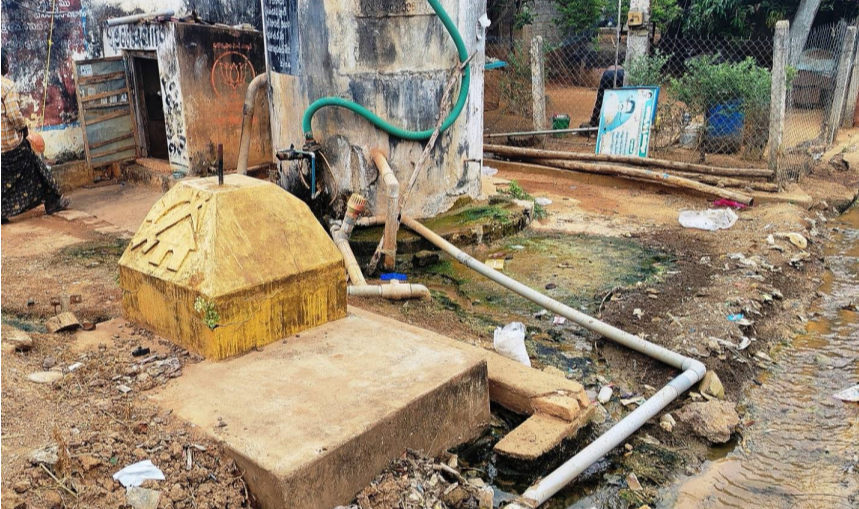
కోడిగూడెం గ్రామంలో ట్యాంకులు

ప్రజలకు సురక్షిత నీటిని అందించే లక్ష్యంతో గ్రామాల్లో ఏర్పాటు చేసిన మంచినీటి పధకాల ఓవర్ హెడ్ ట్యాంకుల పరిశుభ్రతను గాలిశోధింపులో తాగునీరు కలుషిత మవుతోంది. నెలకొని ఉంది. క్షీణనీ షన్ ప్రక్రియ చేపట్టకపోవడంతో ప్రజలు రోగాల బారిన పడుతున్నారు. ద్వారా తిరుమల మండలంలో 30 గ్రామ పంచాయతీలు ఉన్నాయి. ఈ డిప్లొమెన్, పి.డి.ఎస్.ఎస్. పధకాల్లో ఓవర్ హెడ్ ట్యాంకులున్నాయి. వీటి ద్వారా సరఫరా అవుతున్న తాగునీటి శుభ్రత ప్రశ్నార్థకంగా మారింది. వేసవి సమీపించినందున క్షీణనీ షన్ తప్పక చేయాలని పలు గ్రామాల ప్రజలు కోరుతున్నారు