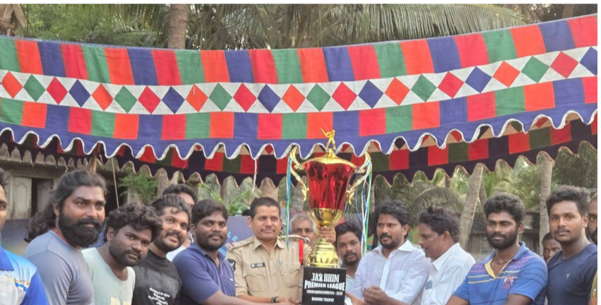
విజేతలకు ట్రోఫీ ప్రధానం