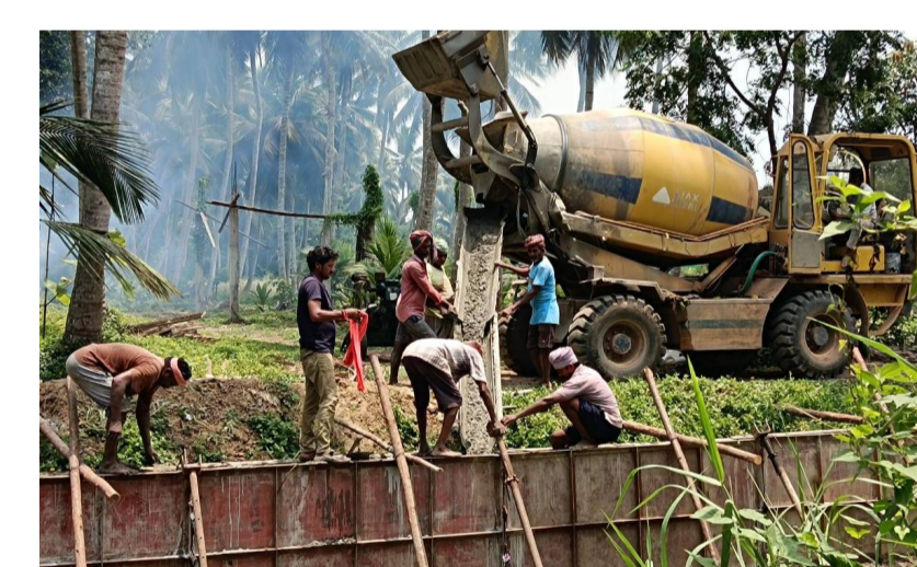
కాట్రోనికోస్ పెన్ పవర్ జూన్ 3

అధికారుల పర్యవేక్షణ లేకపోవడంతో కాంట్రాక్టర్ ఇష్టానుసారంగా పనులు చేపట్టారు.