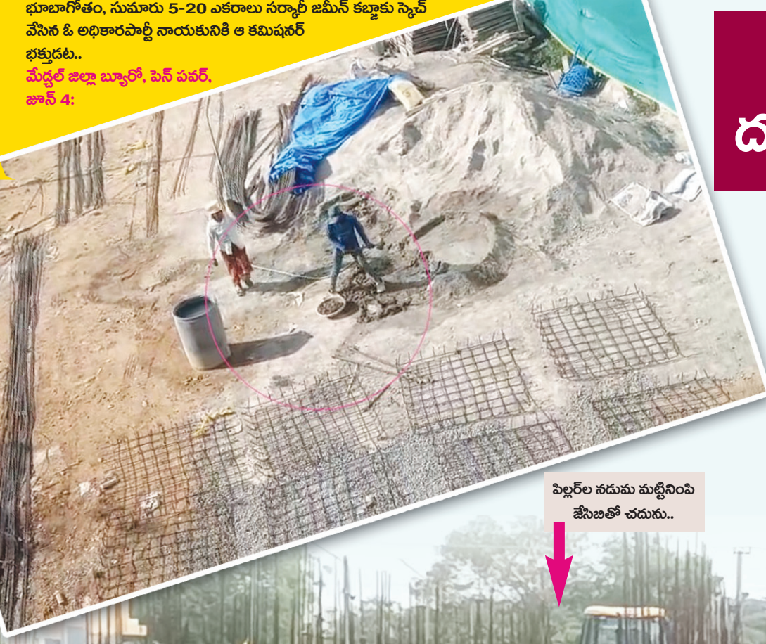
విల్లాల నడుమ మట్టినించి జేసిజతో చదును..