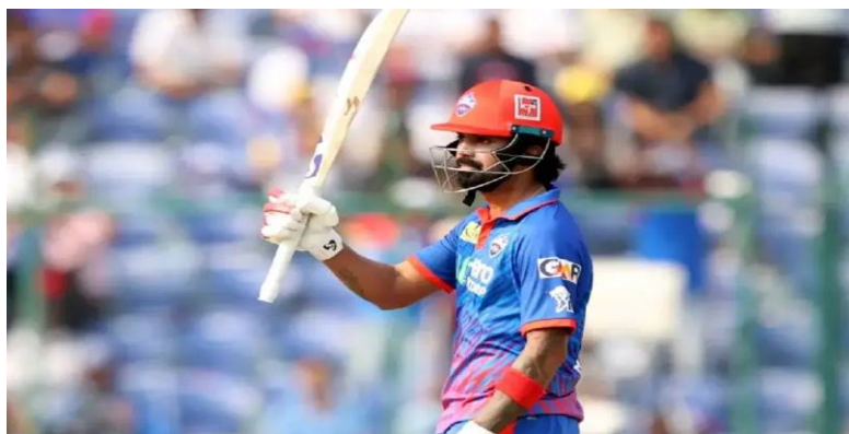
మహారాజా టీ20 లీగ్లో కేవల్ రాహుల్ పూర్తిస్థాయిలో అందుబాటులో ఉండే అవకాశం లేదు.. అందుకే ఫ్రాంచైజీలు అతనిపై బిడ్ వేయడానికి వెనుకాడుగు వేశాయి. కాగా.. ఈ ప్రతిష్టాత్మక మహారాజా ట్రోఫీ టీ20 లీగ్ మ్యాచ్లు మొత్తం హుబ్లీ, మైసూర్, బెంగళూరు నగరాల్లో జరగబోతున్నాయి.

జాతీయ జట్టు బాధ్యతల వల్లే దూరం: ఇలా వరుసగా అంతర్జాతీయ మ్యాచ్లు, జాతీయ జట్టు బాధ్యతలు ఉండటంతోనే ఈ