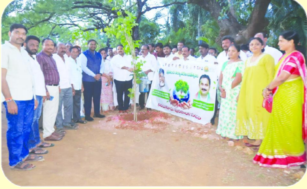
కందుకూరు పెన్ పవర్, జూన్ 5:

-కందుకూరులో సైకిల్ యాత్ర చేసిన ఎమ్మెల్యే, అధికారులు