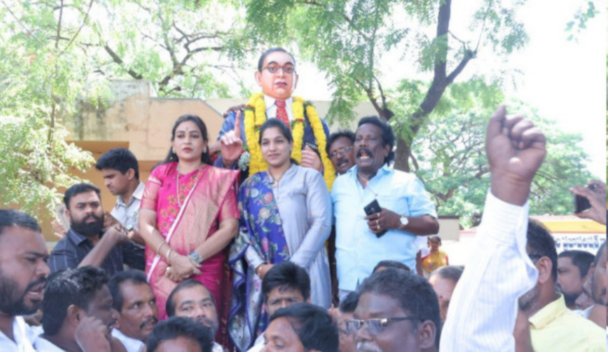
టిడిపి సీనియర్ నాయకులు, ఎస్సీ సోదరులు, కూటమి శ్రేణులు పాల్గొన్నారు.