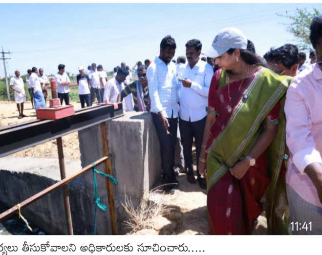
చర్యలు తీసుకోవాలని అధికారులకు సూచించారు....

సూక్ష్మాపట, పెన్ పవర్, జూన్ 6 తిరుపతి జిల్లా సూక్ష్మాపట పట్టణ సమీపంలోని నెల్లూరుకాలనీని శనివారం శాసనసభ్యురాలు డా. నెలవల విజయశ్రీ సందర్శించి, కాలనీ ప్రస్తుత పరిస్థితులను క్షేత్రస్థాయిలో పరిశీలించారు.... ఈ సందర్భంగా కాలనీ నిర్వహణ, నీటి ప్రవాహం, పరిసర ప్రాంతాల పరిస్థితులు మరియు ప్రజలకు ఎదురవుతున్న సమస్యలపై అధికారులతో సమీక్ష నిర్వహించి, అవసరమైన చర్యలు చేపట్టాలని అధికారులను ఎమ్మెల్యే విజయ శ్రీ ఆదేశించారు.... అనంతరం ప్రజలకు ఇబ్బందులు కలగకుండా తగిన