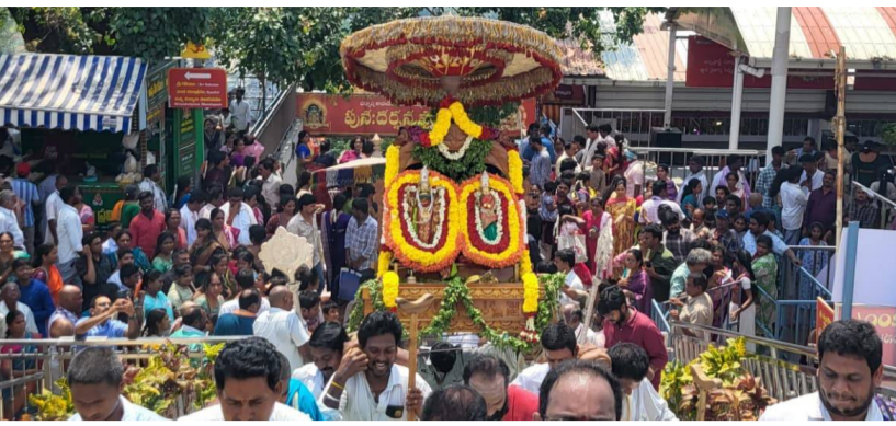
అర్చకులు మరియు దేవస్థానం సిబ్బంది, భక్తులు, గ్రామస్తులు తదితరులు పాల్గొన్నారు.

అన్నవరం పెన్ పవర్ జూన్ 6: కాకినాడ జిల్లా అన్నవరం ప్రముఖ పుణ్యక్షేత్రమైన శ్రీ వీరవేంకట సత్యనారాయణ స్వామి వారి సన్నిధానం లో శనివారం కావడంతో ఘనంగా ప్రాకార సేవ నిర్వహించారు. ముందుగా అర్చకులు సత్యదేవుడు అనంతలక్ష్మి అమ్మవార్ల ఉత్సవ మూర్తులను వివిధ రకాల పుష్పాలతో అలంకరించి తిరుచ్చి వాహనంపై ఆగావించి వేద పండితుల మంత్రోచ్ఛరణ భక్తుల నామస్మరణతో మంగళ వాయిద్యాల సదుపాయం ఆలయం మట్టా ప్రదక్షిణ గాంచారు. ఈ ప్రాకార సేవా కార్యక్రమంలో ఆలయ అర్చకులు,