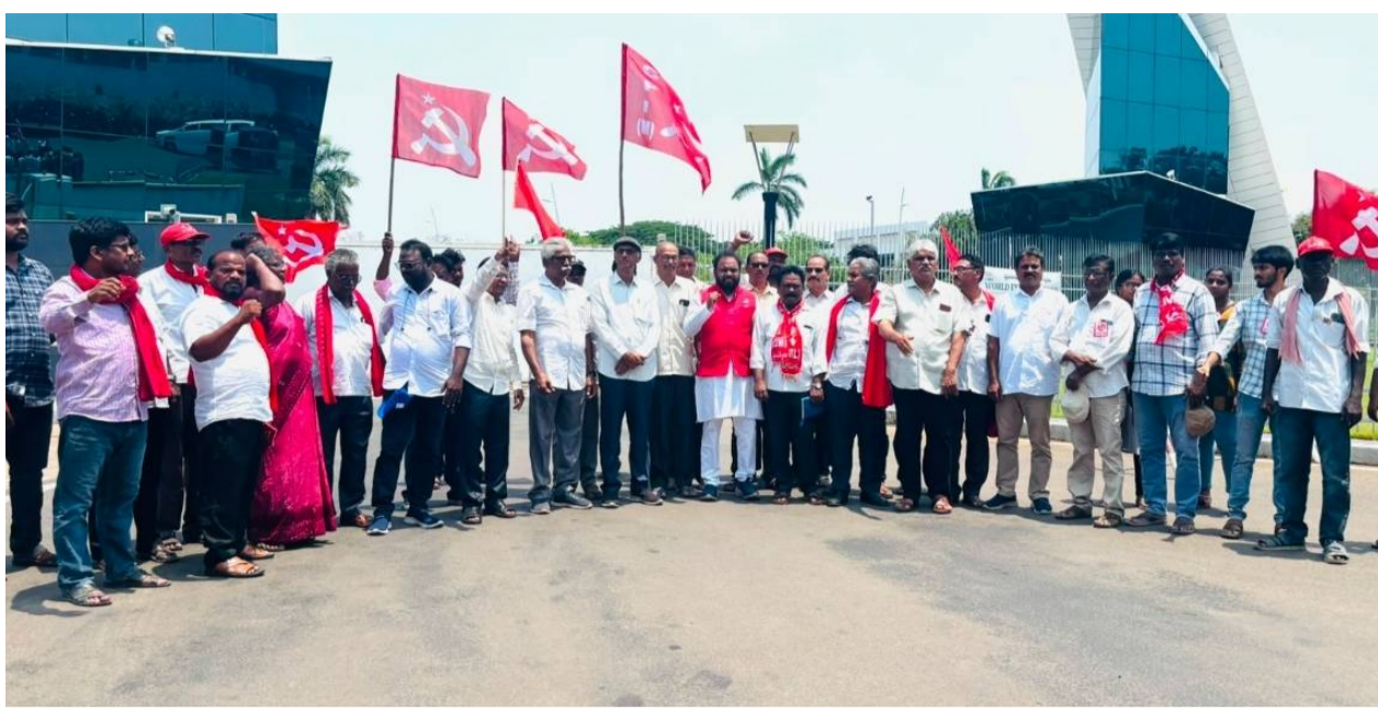
మతపడి వందలాదిమంది ఉపాధి కోల్పోయి వీధుల్లో పడ్డారు. చట్టబద్ధంగా రావాల్సిన చమురు, గ్యాస్ వాటా పొందేలా రాష్ట్ర ప్రభుత్వం నిత్యావసరాలు, తినుబండారాల ధరలు పెరిగాయి. అందువలన కె.జి.బీసీలో ఉత్పత్తి అయ్యే గ్యాస్లో 50% రాష్ట్రానికివ్వాలి, చేస్తున్నాయి.

ఈ సందర్భంగా నాయకులు మాట్లాడుతూ కృష్ణా గోదావరి డి6 బీసీలో ఉత్పత్తి అవుతున్న సహజ వాయువు రిలయన్స్ కంపెనీ ఇక్కడ నుండి మహారాష్ట్ర, గుజరాత్లకు తరలించి వేలకొట్ల రూపాయలు గాలివాటంగా సంపాదిస్తున్నది. అయితే డ్రిల్లింగ్, ఇతర కార్యకలాపాల వలన నిత్య కాలుష్యమేకాక భీష్మబాణాలు, ఇతర ప్రమాదాల్లో రాష్ట్రం విలువైన ప్రాణాలు, కోల్పోతున్నది. ఉత్పత్తిలో 50% రాష్ట్రానికివ్వాలని 12వ ఆర్థిక సంఘం సిఫార్సు చేసినప్పటికీ అమలు కాలేదు. మరోవైపు రాష్ట్రంలో గ్యాస్ దొరకక సాధారణ ప్రజలు, విరు వ్యాపారులు, హాటల్ నిర్వాహకులు తీవ్ర ఇబ్బందులు పడుతున్నారు. అనేక వ్యాపారాలు