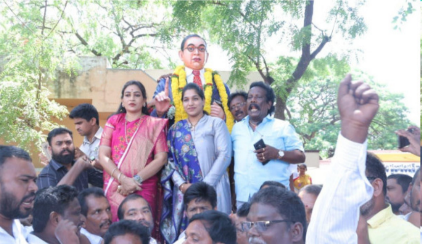
టిడిపి సీనియర్ నాయకులు, ఎస్సీ సోదరులు, కూటమి శ్రేణులు పాల్గొన్నారు.