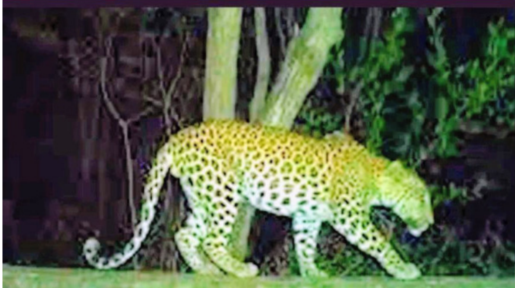
పీలేరు (అన్నమయ్య) : పెన్ పవర్,జూన్ 6పీలేరు మండలంలోని రేగళ్ళు, బాలవారిపల్లి పంచాయతీల పరిధిలో చిరుత పులి సంచరిస్తున్నట్లు వచ్చిన సమాచారం స్థానికంగా కలకలం రేపింది. శనివారం ఉదయం ఉపాధి హామీ పనుల కోసం గ్రామ శివారు ప్రాంతానికి వెళ్లిన ఓ కూలి, పొదల మధ్య చిరుతను పోలిన జంతువు సంచరిస్తున్నట్లు గమనించినట్లు గ్రామస్థులకు తెలిపారు. ఆ కూలి తెలిపిన వివరాలు గ్రామంలో వేగంగా వ్యాపించడంతో స్థానికులు అప్రమత్తమయ్యారు. అయితే ఆ జంతువును చూసిన కొద్ది సేపటికే అది అడవివైపు వెళ్లిపోయినట్లు సమాచారం. దీంతో గ్రామస్థులు అప్రమత్తంగా ఉండాలని పరస్పరం హెచ్చరికలు చేసుకుంటున్నారు. ఇదే విషయాన్ని కొందరు గ్రామస్థులు అటవీ శాఖ అధికారుల దృష్టికి తీసుకెళ్లినట్లు తెలిసింది. చిరుత సంచారంపై అధికారికంగా నిర్ధారణ కావాల్సి ఉన్నప్పటికీ, ఈ వార్త గ్రామాల్లో చర్చనీయాంశంగా మారింది గ్రామ శివారు ప్రాంతాల్లో వ్యవసాయ పనులు, ఉపాధి హామీ పనులకు వెళ్లే కూలీలు, రైతులు, పశువుల కాపరులు అప్రమత్తంగా ఉండాలని స్థానికులు సూచిస్తున్నారు. అటవీ శాఖ అధికారులు ఘటనపై దృష్టి సారించి, అవసరమైతే క్షేత్రస్థాయిలో పరిశీలనలు చేపట్టి ప్రజల్లో అవగాహన కల్పించడంతో పాటు ఎలాంటి అవాంఛనీయ ఘటనలు చోటుచేసుకోకుండా ముందస్తు చర్యలు తీసుకోవాలని గ్రామస్థులు కోరుతున్నారు.