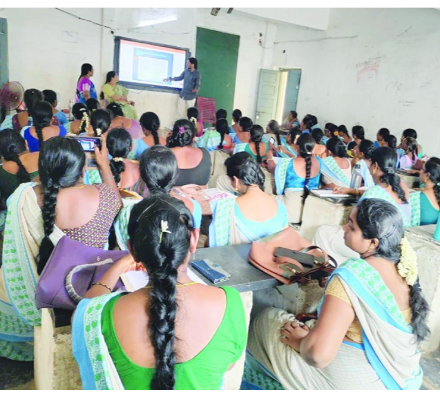
దాసకొండ జూన్ 9 పెన్ పవర్ మండల కేంద్రంలో స్థానిక జడ్.పి.పాస్ హై స్కూల్ లో ఏఐ