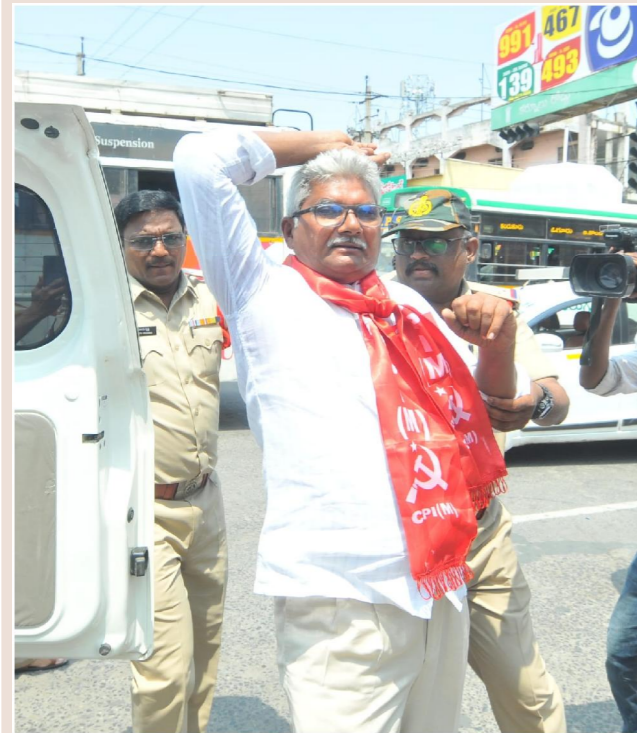
క్రమ రిపోర్టర్ పెన్ పవర్, ఒంగోలు జూన్ 09 కేంద్ర రాష్ట్ర ప్రభుత్వాల మే నెలలో 4 సార్లు పెట్రోలు డీజిలు, వంటగ్యాస్ ధరలు పెంచినది, ఈ భారాలతో ప్రజలు అల్లాడుతున్నారని, మోడీ ప్రభుత్వం గత 12 సంవత్సరాలు పాలన వైఫల్యాలను