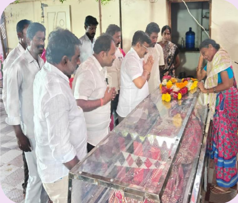
పామూరు, పెన్ పవర్, జూన్ 9