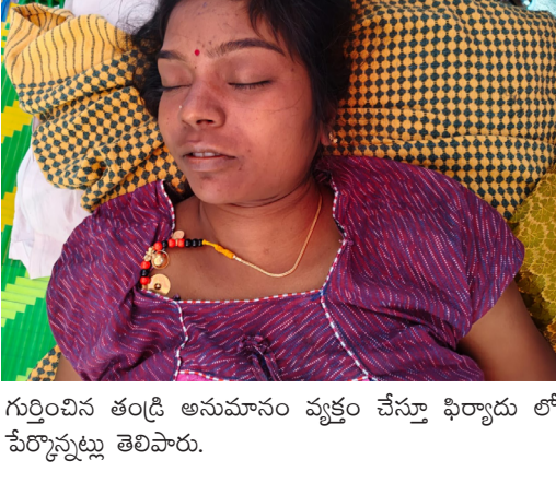
గుర్తించిన తండ్రి అనుమానం వ్యక్తం చేస్తూ ఫిర్యాదు లో పేర్కొన్నట్లు తెలిపారు.