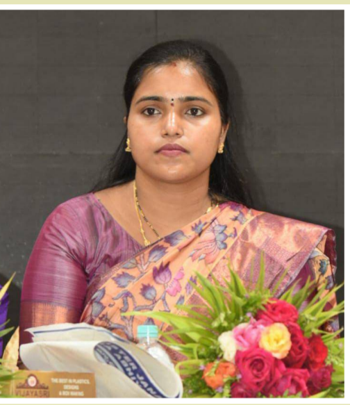
బాధిత కుటుంబాలకు అండగా ఉంటారని ఆమె పేర్కొన్నారు.