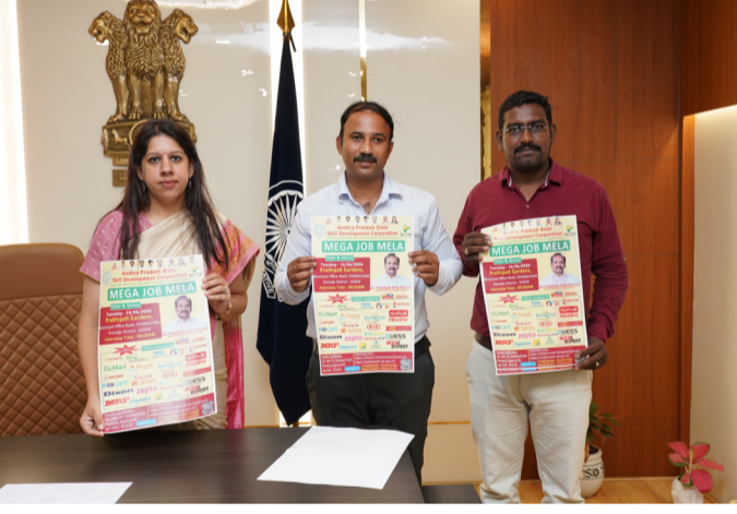
జాబ్ మేళా ప్రాంగణంలోనే రిజిస్ట్రేషన్ చేసుకునే సౌకర్యం కల్పించనున్నట్లు తెలిపారు. మరిన్నివివరాలకు 7842747682, 7779858789, 7702921219, 9848793357నంబర్లను సంప్రదించాలని జిల్లా నైపుణ్యాభివృద్ధి అధికారులు కోరారు.