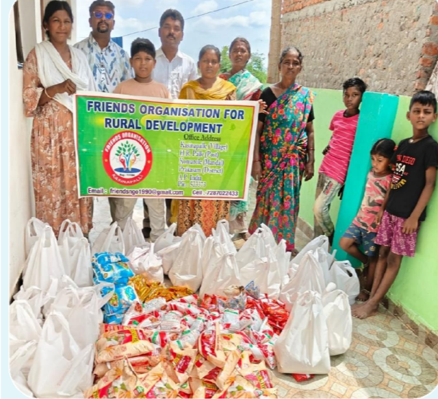
కొమరోలు, పెన్ పవర్ జూన్ 13 గిద్దలూరు -సంచాలకు మధ్య ఉన్న నల్లమల అటవీ ప్రాంతంలో గల

నల్లమల అడవి ప్రాంతంలో గల పచ్చర్ల గ్రామస్తులకు నిత్యావసర వస్తువులు పంపిణీ చేసిన ఫ్రెండ్స్ ఆర్గనైజేషన్ ఫర్ రూరల్ డెవలప్మెంట్