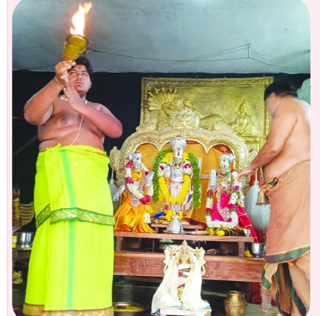
గిద్దలూరు పెన్ పవర్ జూన్ 13

గిద్దలూరు నియోజక వర్గం నలమల్ల గిరుల కీకారణం లో వెలసిన ఈ ప్రాంత వాసుల ఇలావేల్సు , పిలిప్పి పలికే దేవుడు నెమలిగుండ్ల రంగనాయక స్వామి కల్యాణం అలయ అర్చకులు కమణీయంగా కన్నులపడుపుగా నిర్వహించారు. ఒక్క శనివారం మాత్రమే తలుపులు తెరుచుకుని ఈ అలయంలో ప్రతీ రెండవశనివారం నెమలిగుండ్ల రంగడి కల్యాణం కనులవిడుగా నిర్వహించటం ఇక్కడ ఆనవాయితీ. ఇరువురు దేవేరులతో కల్యాణం నిర్వహిస్తారు. రంగడి కల్యాణం తిలకించేందుకు భక్తులు పోటెత్తారు. సన్యాసగుండంగా అలంకరించిన రంగాన్ని ఉత్సవమూలన కల్యాణ మండపానికి వేంచేపిం చేసి కనులవిడుగా నిర్వహించారు. కల్యాణం తంతును అర్చకులు ఆగమ శాస్త్రం సాంప్రదాయం ప్రకారం నిర్వహించారు. వేదపండితుల మంత్రోచ్ఛారణల మధ్య యజ్ఞోపవీత్ర ధారణ , జీలకర్ర బెల్లం , మాంకళ్ళ ధారణ, బంధితబ , తదితర కార్యక్రమాలను నిర్వహించారు. రెండవశనివారం కావటంతో భక్తులు అలయనికి పోటెత్తారు. ఈ సందర్భంగా రంగస్వామి సేవను ఘనంగా నిర్వహించారు రంగడి సేవ భక్తుల ను గంగగృతులు గోలిపింది. భక్తుల గోవిందా నామస్మరణతో నలమల్ల గిరుల మార్కోగాయ. భక్తుల దర్శనార్థం అలయకమిటీ , ఈడీ నాయలు అన్ని సౌకర్యాలు కల్పించారు. పలు నశ్రాలలో అన్నప్రసాద వితరణ చేశారు.