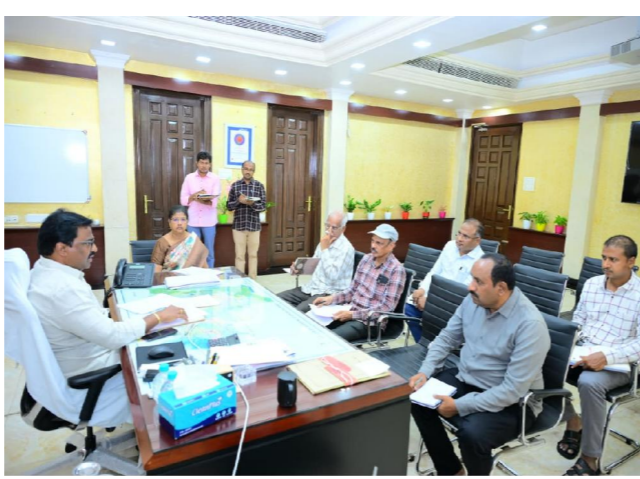
స్టాఫ్ రిపోర్టర్ పెన్ పవర్, ఒంగోలు జూన్ 13 జిల్లాలో పెట్టుబడులు పెట్టేందుకు ఈనెల 22వ తేదీన

విద్వాలపై దృష్టి సారించాలని కలెక్టర్ ఆదేశం