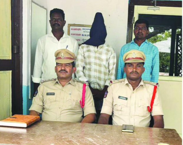
గుడ్లూరు, పెన్ పవర్, జూన్ 13:

రెండు రోజుల్లో ముద్దాయి పట్టివేత -పోలీసులకు ఉన్నతాధికారుల అభినందనలు