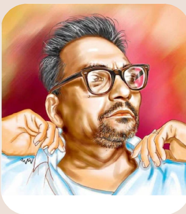
కల్చరల్ రిపోర్టర్, పెన్ పవర్ ఒంగోలు జూన్ 13 మహాప్రస్థానం కావ్యం ద్వారా అత్యంత ప్రజాదరణ పొందిన శ్రీ శ్రీ