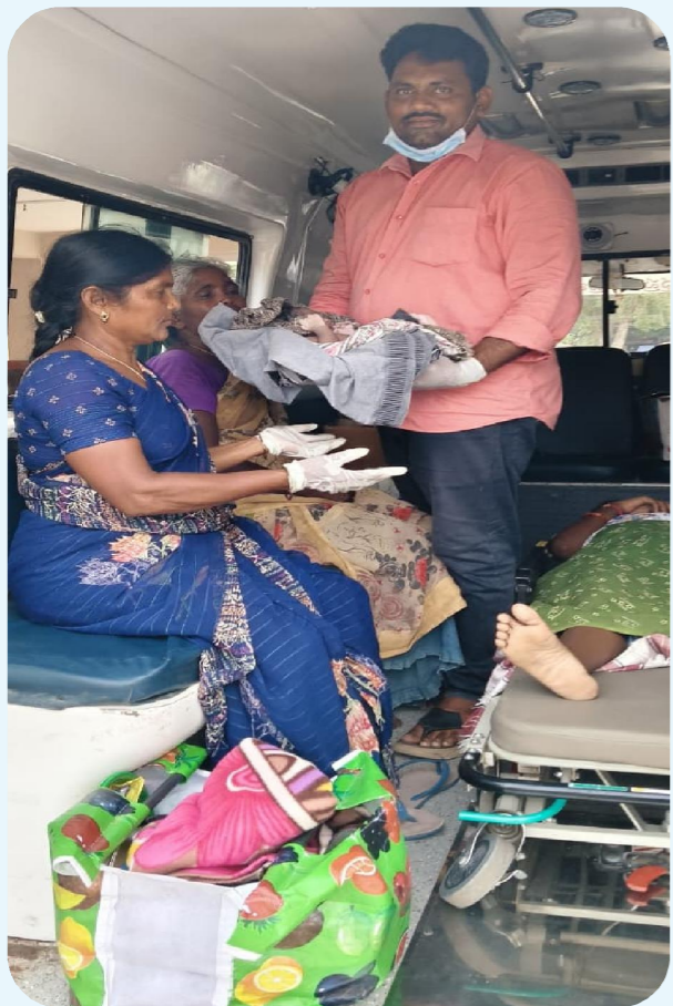
పెన్ పవర్, సంతమాగులూరు, జూన్ 13

సంతమాగులూరు గ్రామానికి చెందిన ఎస్ట్రే రాణికి శనివారం సాయంత్రం పులి నోపులు ప్రారంభమయ్యాయి. నోపులు అధికం కావడంతో 108కి సమాచారం అందించారు. సిబ్బంది ఘటనా స్థలానికి చేరుకొని సరసాపువేల ప్రభుత్వ ఆసుపత్రికి తరలిస్తుండగా పులి నోపులు ఎక్కడ కావడంతో ఈవంటి అశోక్ మార్గం మధ్యలో వాహనం ఆపి సుఖ ప్రసవం చేశారు. ఎస్ట్రేరాణి ఆడ బిడ్డకు జన్మనిచ్చింది. తల్లిబిడ్డ క్షేమంగా ఉండటంతో కుటుంబ సభ్యులు సిబ్బందికి కృతజ్ఞతలు తెలిపారు.