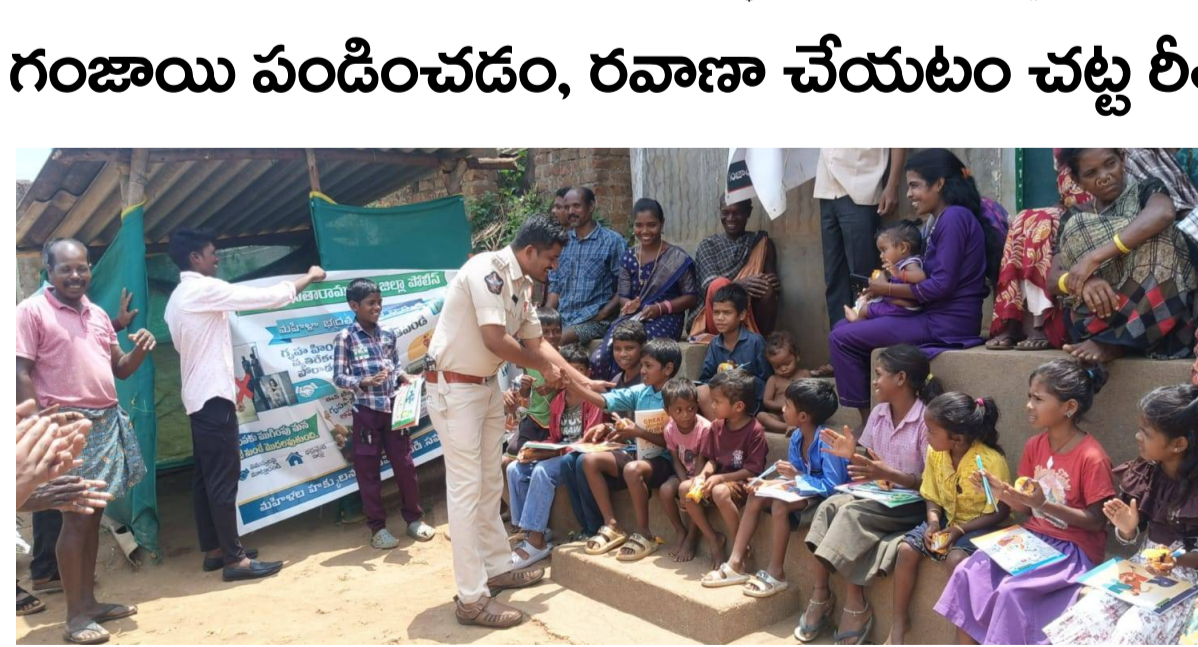
డుంట్రిగూడ పెన్ పవర్ జూన్ 13: జిల్లా ఎస్పీ అమితే బర్జర్ ఆదేశాల మేరకు మండలంలో గసభ పంచాయతీ గసభ మరియు గొందిగుడ