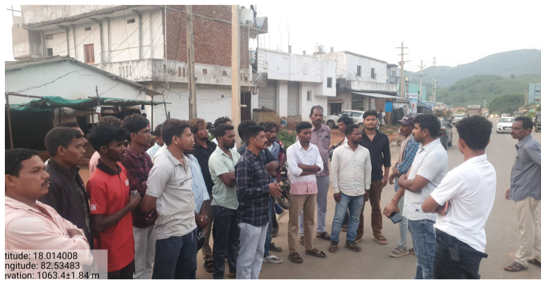
జి.మాడుగుల. పెన్ పవర్ జూన్(13) వాహనదారులు తప్పనిసరిగా తనిఖీలో పోలిస్ సిబ్బంది పాల్గొన్నారు. హెల్మెట్ ధరించి, వాహన పత్రాలు, డ్రైవింగ్ లైసెన్స్ వెంట