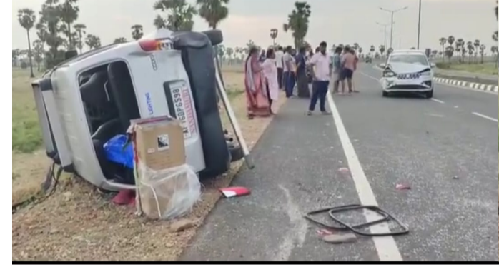
జరగలేదు. ప్రమాదానికి గురైన వాహనాల్లో ఒకటి గుంటూరు ప్రాంతానికి చెందినదిగా, మరొకటి చీరాల ప్రాంతానికి చెందినదిగా స్థానికులు తెలిపారు. ప్రమాదానికి గల ఖచ్చిత కారణాలు పోలీసుల విచారణలో వెల్లడికావాల్సి ఉంది.

బాపట్ల:( పెన్ పవర్ ) బాపట్ల జిల్లా వాడరేవు సమీపంలోని నూతన బైపాస్ రోడ్డుపై శుక్రవారం రోడ్డు ప్రమాదం చోటుచేసుకుంది. ఈ ఘటనలో ముగ్గురు గాయపడ్డారు. వారిలో ఒకరికి తీవ్ర గాయాలు కాగా, ఇద్దరికి స్వల్ప గాయాలయ్యాయి. స్థానికల సమాచారం ప్రకారం, ఒక కారు రాంగ్ రూట్ లో రావడంతో ఎదురుగా వచ్చి మరో కారును ఢీకొట్టింది. ఢీకొట్టిన తీవ్రతకు ఒక కారు బోల్తా పడగా, మరో కారుకు తీవ్ర నష్టం వాటిల్లింది. గాయపడిన వారిని వెంటనే సమీప ఆసుపత్రికి తరలించి చికిత్స అందిస్తున్నారు. అయితే ఈ ఘటనలో ఎలాంటి ప్రాణనష్టం