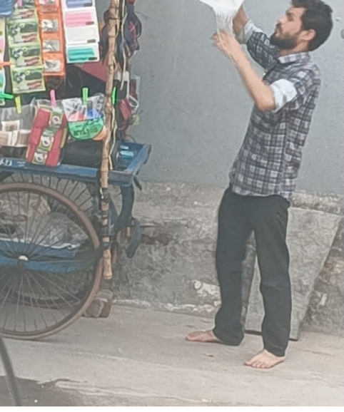
అధికారులు విచారణ చేపట్టాలని కూడా సూచిస్తున్నారు.

బాపట్ల:(పెన్ పవర్) జూన్ 13 బాపట్ల పట్టణంలో వ్యాపార నిమిత్తం ఇతర రాష్ట్రాలకు చెందిన కొందరు వ్యక్తులు పెద్ద సంఖ్యలో సంచరిస్తున్నట్లు స్థానికులు చెబుతున్నారు. వీరిలో కొందరు లాడ్జిల్లో బస చేస్తుండగా, మరికొందరు వివిధ వార్డుల్లో అద్దె ఇళ్లలో నివాసం ఉంటూ గాజులు, ప్లాస్టిక్ వస్తువులు, బొట్టు బిళ్ళలు తదితర సామగ్రిని విక్రయిస్తున్నట్లు సమాచారం. వీరు ప్రధానంగా హిందీ భాషలో మాట్లాడుతుండటంతో స్థానికులకు వారితో సంభాషణలో ఇబ్బందులు ఎదురవుతున్నాయని, వాబాపట్లలో ఇతర రాష్ట్రాల వ్యాపారులపై స్థానికుల్లో అనుమానాలు వివరాలపై స్పష్టత లేకపోవడం వల్ల పలు అనుమానాలు వ్యక్తమవుతున్నాయని పలువురు పేర్కొంటున్నారు. ఈ నేపథ్యంలో సంబంధిత శాఖ అధికారులు, పోలీసులు వారి గుర్తింపు పత్రాలు, నివాస వివరాలు, వ్యాపార అనుమతులు తదితర అంశాలను పరిశీలించి అవసరమైన సమాచారాన్ని సేకరించాలని స్థానికులు కోరుతున్నారు. అయితే కేవలం ఇతర రాష్ట్రాలకు చెందినవారిగా లేదా హిందీ మాట్లాడుతున్నారనే కారణంతో ఎవరిపైనా అనుమానాలు వ్యక్తం చేయకుండా, చట్టబద్ధమైన విధానంలోనే