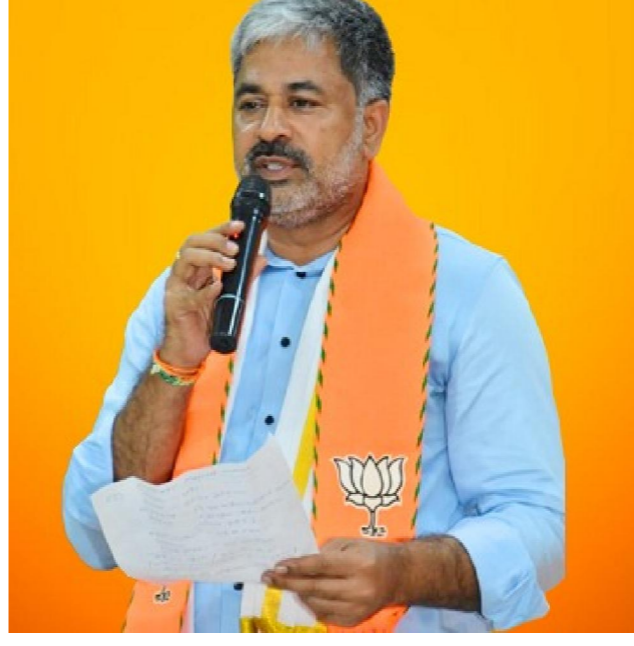
ప్రభుత్వం భారీ స్కాలర్లలో సహకారం అందిస్తూ రాష్ట్ర పురోగతికి బాటలు వేస్తోందని చెప్పారు.