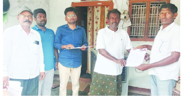
కొమరోలు పెన్ పవర్ జూన్ 15