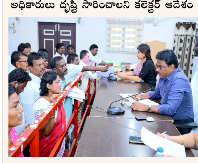
త్రైవేణి రిపోర్టర్ పెన్ పవర్, ఒంగోలు జూన్ 15

- 119 అర్జీల రాక - అర్జీల పరిష్కారంపై అధికారులు దృష్టి సారించాలని కలెక్టర్ ఆదేశం