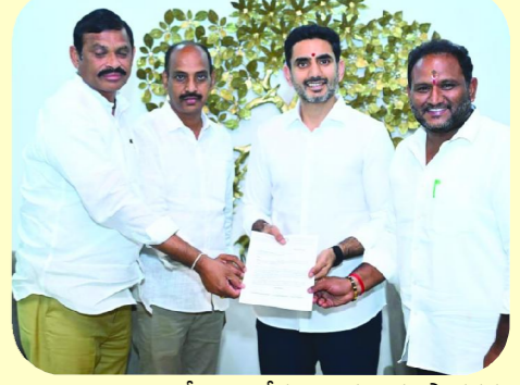
పెంచాలని ఎమ్మెల్యేలు కోరగా, ఈ ప్రతిపాదనను పరిశీలిస్తామని మంత్రి పేర్కొన్నట్లు సమాచారం. మండల విద్యాశాఖ అధికారులు (ఎంఈవో) నామినేషన్ల మార్పు అంశంపై కూడా సమావేశంలో చర్చ జరిగినట్లు తెలిసింది. దీనికి సంబంధించిన పరిష్కారాల అంశాలను ప్రభుత్వం పరిశీలించనున్నట్లు సమాచారం. విద్యార్థుల ఫీజు రీయంబర్స్ మెంట్ నిధుల విడుదలపై ఎమ్మెల్యేలు ప్రస్తావించగా, ప్రభుత్వం ప్రతి నెలా రూ.200 కోట్ల మేర నిధులు విడుదల చేస్తోందని మంత్రి నారా లోకేష్ వివరించినట్లు వెల్లడించారు. ఉద్యోగులు, ఉపాధ్యాయులు, నిరుద్యోగ యువత సంక్షేమానికి సంబంధించిన పలు అంశాలపై జరిగిన ఈ సమావేశం ప్రాధాన్యత సంతరించుకుంది. త్వరలో ప్రభుత్వ స్థాయిలో తీసుకునే నిర్ణయాలపై ఆయా వర్గాలు ఆసక్తిగా ఎదురుచూస్తున్నాయి.

కందుకూరు పెన్ పవర్, జూన్ 15: ఉద్యోగులు, ఉపాధ్యాయులు, నిరుద్యోగ యువత ఎదుర్కొంటున్న పలు సమస్యలపై పట్టణస్థాయి ఎమ్మెల్యేలు వేపాడ చిరంజీవి రావు, కంచర్ల శ్రీకాంత్, భూమిరెడ్డి రంగేష్ నోమవారం రాష్ట్ర మానవ వనరుల అభివృద్ధి (హెచ్ఆర్డీ) శాఖ మంత్రి నారా లోకేష్ ను ఆయన క్యాంపు కార్యాలయంలో కలిసి వివరించారు. ఈ సందర్భంగా పలు కీలక అంశాలపై మంత్రి సానుకూలంగా స్పందించినట్లు ఎమ్మెల్యేలు తెలిపారు. ఇన్ సర్వీస్ ఉపాధ్యాయులకు ప్రత్యేక టెట్ (టీచర్ ఎలిజిబిలిటీ టెస్ట్) నిర్వహించాలని ఎమ్మెల్యేలు కోరగా, త్వరలో ప్రత్యేక టెట్ నిర్వహణకు అవసరమైన చర్యలు చేపడతామని మంత్రి నారా లోకేష్ హామీ ఇచ్చినట్లు సమాచారం. ఈ నిర్ణయం వేదిక మంది ఉపాధ్యాయులకు ప్రయోజనం చేకూర్చే అవకాశం ఉందని ఉపాధ్యాయ వర్గాలు భావిస్తున్నాయి. అదేవిధంగా ఏపీపీఎస్సీ పరీక్షలకు హాజరయ్యే నిరుద్యోగ యువతకు వయో పరిమితిలో సడలింపు (ఎజ్ రిలాక్వేషన్) కల్పించాలని ఎమ్మెల్యేలు కోరారు. ఈ అంశంపై కూడా మంత్రి సానుకూలంగా స్పందించినట్లు తెలుస్తోంది. ప్రభుత్వం నిర్ణయం తీసుకుంటే నిరుద్యోగ యువతకు ఇది ఊరట కలిగించే అవకాశముంది. కాంట్రాక్ట్, ఎంపీటీఎస్ ఉద్యోగుల పదవీ విరమణ వయస్సును ప్రస్తుతం ఉన్న 60 సంవత్సరాల నుంచి 62 సంవత్సరాలకు