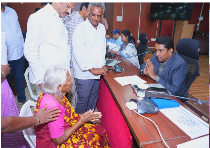
క్షేత్రస్థాయి వరకు అధికారులు సమన్వయంతో పనిచేయాలని ఆదేశించారు. ప్రజా వినతులపై స్పందన వేగవంతమైతేనే ప్రజలలో ప్రభుత్వంపై విశ్వాసం మరింత బలపడుతుందని పేర్కొన్నారు...

విజయవాడ, పెన్ వవర్, జూన్ 15, ప్రజల సమస్యలపై సత్వరం స్పందించి... వీలైనంత త్వరగా నాణ్యతతో పరిష్కరించడం జరుగుతోందని.. ఇదేవిధంగా ముందుకు వేస్తూ ప్రతిఅధికారి అర్థీలపై ప్రత్యేక దృష్టిపెట్టి ప్రజలకు సంతృప్తికర సేవలు అందించాలని జిల్లా కలెక్టర్ డా. జి.లక్ష్మీశ అన్నారు కలెక్టర్ లక్ష్మీశ... జాయింట్ కలెక్టర్ ఎస్.ఇలక్కియ, అధికారులతో కలిసి సోమవారం ప్రజా స్నేహపూర్వక పీజీఆర్ఎస్ కార్యక్రమం ద్వారా కలెక్టరేట్ శ్రీ పింగళి వెంకయ్య సమావేశ మందిరంలో ప్రజల నుంచి అర్థీలు స్వీకరించారు. మొత్తం 201 అర్థీలు రాగా వీటిలో రెవెన్యూకు సంబంధించి 56, పురపాలక శాఖకు సంబంధించి 31, పోలీస్ శాఖకు 29, పంచాయతీరాజ్ శాఖకు 17, డిఆర్డీఏకు 10 అర్థీలు వచ్చాయి. విద్యుత్ కు 9, వైద్య ఆరోగ్యానికి 7, ప్రజావాణికి 6, ఏపీఎస్ఐఆర్ఐఐకావెన్కు 5, కాలవ్యవసాయం/త్రణకు 4, ఎండోమెంట్స్, గ్రామీణ నీటి సరఫరా శాఖలకు మూడు చొప్పున, పౌర సరఫరాలు, విభిన్న ప్రతిభాపంతులు, విద్య, ఉపాధికల్పన, గృహ నిర్మాణం, కార్మిక, మైన్స్ అండ్ జియోలాజీ, రిజిస్ట్రేషన్ అండ్ స్టాంపుకు రెండు చొప్పున అర్థీలు వచ్చాయి. బీసీ సంక్షేమం, సహకార, డ్యామా, మత్స్య, జాతీయ రహదారులు విభాగాలకు ఒకటి చొప్పున వచ్చాయి. ఈ అర్థీలపై ప్రత్యేకంగా దృష్టిసారించి నిర్దేశ గడువులోగా పరిష్కరించాలని అధికారులను కలెక్టర్ లక్ష్మీశ ఆదేశించారు. సంక్షేమ స్థాయి బాగుండేలా అర్థీలను పరిష్కరించాలని.. ఈ విషయంలో జిల్లాస్థాయి నుంచి