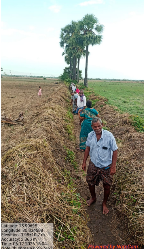
బాపట్ల: ( పెన్ వవర్ ) జూన్ 15 వర్షం నీటిని భద్రపరిచేందుకు ప్రభుత్వం తీసుకున్న నిర్ణయం రైతుల్లో ఉత్సాహం నింపుతోంది. దశాబ్దాలుగా సాగునీరు లేక ఎండిన భూములన్ని సాగులోకి రానున్నాయి. బీడు భూముల్లో ఇప్పుడు నీరులు పండనున్నాయి. కొన్నేళ్లుగా ఎదురు చూస్తున్న రైతుల ఆశలు నేడు నెరవేరుతున్నాయి. రానున్న వర్షాకాలం నాటికి కాల్వల ద్వారా చివరి భూములకు సాగునీరు అందించాలని ప్రభుత్వం సంకల్పించింది. దీంతో భూగర్భ జలాలు మరింత పెరగనున్నాయి. అడుగంటిన భూగర్భ జల మట్టం పెరిగితే రైతులకు ఎంతో మేలు జరగనుంది. ఇప్పుడు రైతులంతా ఏకమై శ్రమదానం చేస్తున్నారు. ప్రభుత్వం తీసుకున్న నిర్ణయం తక్షణమే అమలు చేసేలా వడివడిగా అడుగులు ముందుకు వేస్తోంది.