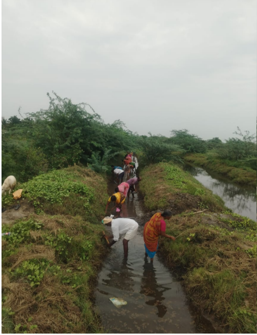
చిల్ల చెట్లు తొలగించడం, మేటవేసిన మట్టి పూడికతీత పనులు చేపట్టారు. 25 మంది రైతులు ముందుకు వచ్చి శ్రమదానం చేస్తున్నారు. 1,500 మీటర్ల పొడవున, ఒక మీటర్ వెడల్పుతో ఒక మీటర్ లోతున కాల్వ తవ్వకాల పనులు మొదలయ్యాయి. భూగర్భ జలం కాల్వ పునరుద్ధరణ పనులతో అడుగంటిన భూగర్భ జలాలు పెరగనున్నాయి. వర్షాలు కురిస్తే ఆ కాల్వల పూర్తిగా నీటితో నిండేలా పనులు చేస్తున్నారు. ఆ ప్రాంతంలో కురిసిన వర్షం నీరంతా కాల్వలోకి చేరనుంది. తద్వారా భూగర్భ జలాలు క్రమేపి పెరగనున్నాయి. జలధార జలహారతి కార్యక్రమాలు రైతుల్లో ఉత్సాహం నింపుతోంది. తక్షణమే పనులు చేయాలని ఆదేశాలు ఇవ్వడంతో రైతులంతా ఏకమై శ్రమదానం చేస్తున్నారు. వడివడిగా కాల్వ పునరుద్ధరణ పనులు కొనసాగుతున్నాయి.

ప్రయోజనం బోలెడు కొన్నేళ్లుగా నిరుపయోగంగా మారిన భూములన్ని జలధార జలహారతి కార్యక్రమం ద్వారా ఇప్పుడు వినియోగంలోకి రానున్నాయి. ప్రభుత్వం చేపట్టిన కార్యక్రమాలతో అడుగంటిన భూగర్భ జలాలు మెరుగుపడుతున్నాయి. కాల్వ శుభ్రం చేయడం ద్వారా చుట్టూరకు 30 మంది రైతులకు లబ్ధి చేకూరనుంది. కాల్వ దిగువ ప్రాంతాలలోని 25 ఎకరాలు సాగు లోకి వస్తాయి. నిలిచిపోయిన వ్యవసాయం ఇప్పుడు సాగులోకి రానుంది. పరోక్షంగా సమీపంలోని భూములలో ఉన్న బోర్ బావులన్ని రీఛార్జ్ కానున్నాయి. వ్యవసాయం లాభసాటిగా మారనుంది. ఆ ప్రాంతంలో భూములకు భవిష్యత్తులో నీటి కొరత తీరనుంది. పంట దిగుబడులు మరింత పెరగనున్నాయి. జలధార జలహారతి తో రైతులకు ఎంతో ప్రయోజనం కలుగుతుంది.