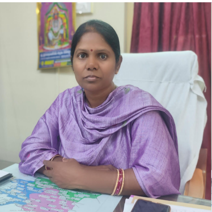
నెంబర్లలో ఏవైనా తప్పులు ఉంటే ఎన్యూఐఆర్ఎస్ ఫారాల ద్వారా పీఎల్ఓలకు సమర్పించవచ్చని తెలిపారు. వీటితో పాటు ప్రజలు స్వయంగా ఈసీఐ పోర్టల్ ద్వారా ఆన్లైన్లో కూడా తమ వివరాలను ఉచితంగా సవరించుకోవచ్చని, దేలాను ఆన్లైన్లో చేసుకోవచ్చని సూచించారు. ఓటర్లందరూ తమ వివరాలను సరిచూసుకుని, ఓటర్ల జాబితా పారదర్శకంగా ఉండేలా తమ ఇంటికి వచ్చే పీఎల్ఓలకు పూర్తిస్థాయిలో సహకరించాలని ఈఆర్ఓ లీలారాణి కోరారు.

చిలకలూరిపేట , పెన్ వవర్, జూన్ 15 : చిలకలూరిపేట అసెంబ్లీ నియోజకవర్గ పరిధిలో ఓటర్ల జాబితా ప్రత్యేక సవరణ ఎస్ ఐ ఆర్ ప్రక్రియ వేగంగా జరుగుతోందని నియోజకవర్గ ఎన్నికల అధికారి ఈఆర్ఓ బి. లీలారాణి తెలిపారు. నియోజకవర్గంలో మొత్తం 242 పోలింగ్ కేంద్రాలు ఉన్నాయని, వాటన్నింటికీ బూత్ లెవెల్ ఆఫీసర్లు , సూపర్వైజర్లు ఇప్పటికే నియమించడం జరిగిందని ఆమె పేర్కొన్నారు. ఇప్పటివరకు అసెంబ్లీ నియోజకవర్గ పరిధిలో 66% ఓటర్ల మ్యూపింగ్ను పీఎల్ఓలు విజయవంతంగా పూర్తి చేశారని ఈఆర్ఓ వెల్లడించారు. ఈ రోజు నుండి ప్రోగ్రాంలో భాగంగా ఎన్యూఐఆర్ల ద్వారా ఓటర్లందరికీ ఎన్యూఐఆర్ఎస్ ఫారాల పంపిణీ ప్రక్రియ ప్రారంభమవుతుందని చెప్పారు.