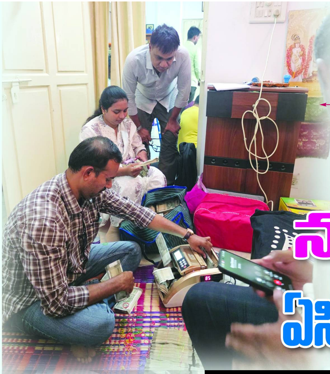
ఏసీబి సోదాలు నిర్వహించిన తాజా ఫోటో..