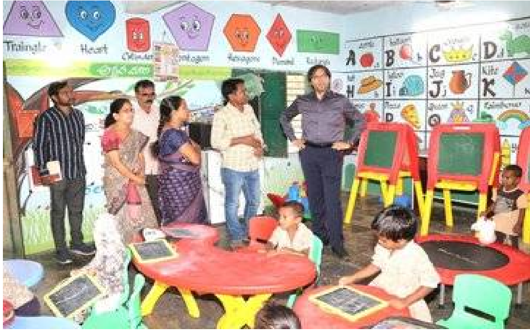
చేరికలు పెంచాలని ఆదేశించారు.విద్యార్థులకు మెరుగైన విద్యా అవకాశాలు, పిల్లలకు నాణ్యమైన పోషకాహార సేవలు అందించేందుకు అధికారులు నిరంతరం పర్యవేక్షణ కొనసాగించాలని అయన సూచించారు.

జిల్లా కలెక్టర్ అంకిత్ భద్రాద్రి కొత్తగూడెం: పెన్ పవర్: జిల్లాలో ప్రభుత్వ పాఠశాలలు, అంగన్వాడీ కేంద్రాల్లో విద్యార్థుల హాజరు శాతం పెంచడంతో పాటు నాణ్యమైన విద్య, పోషకాహార సేవలు అందేలా చర్యలు చేపట్టాలని జిల్లా కలెక్టర్ అంకిత్ ఆదేశించారు.ఆళ్లపల్లి మండల పర్యటనలో భాగంగా ఆళ్లపల్లి మండల ప్రాథమిక పాఠశాలను ఆకస్మికంగా తనిఖీ చేసిన జిల్లా కలెక్టర్ అంకిత్, విద్యార్థుల సంఖ్య, హాజరు వివరాలను పరిశీలించారు. పాఠశాల అవసరాలలోని ప్రి-ప్రైమరీ పాఠశాల, అంగన్వాడీ కేంద్రం నిర్వహణపై సమీక్షించారు. తల్లిదండ్రులతో నిరంతర సంప్రదింపులు జరిపి ప్రభుత్వ పాఠశాలల్లో అందిస్తున్న నాణ్యమైన విద్య, సౌకర్యాలపై అవగాహన కల్పించాలని సూచించారు. అంగన్వాడీ కేంద్రంలో పిల్లలకు అందిస్తున్న భోజనం, పాలు, బాలామృతం తదితర పోషకాహార సేవలను పరిశీలించి హాజరు తక్కువగా ఉండటంపై ప్రత్యేక చర్యలు తీసుకోవాలని ఆదేశించారు. తరువాత పెద్ద వెంకటాపురం గ్రామంలోని ప్రాథమిక పాఠశాలను సందర్శించి గుత్తికోయలు నివసించే ఈ గిరిజన ప్రాంతంలో బడిఈడు పిల్లలందరూ పాఠశాలకు హాజరయ్యేలా ప్రత్యేక కార్యచరణ చేపట్టాలని సూచించారు. అంగన్వాడీ కేంద్రాల్లో అదనపు నిల్వలను అవసరమైన చోటుకు తరలించాలని, కేంద్రాలను పరిశుభ్రంగా నిర్వహిస్తూ పిల్లల