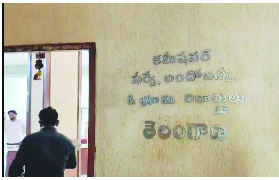
ఆర్డిడి సర్వే కమిషనరీ కార్యాలయం..