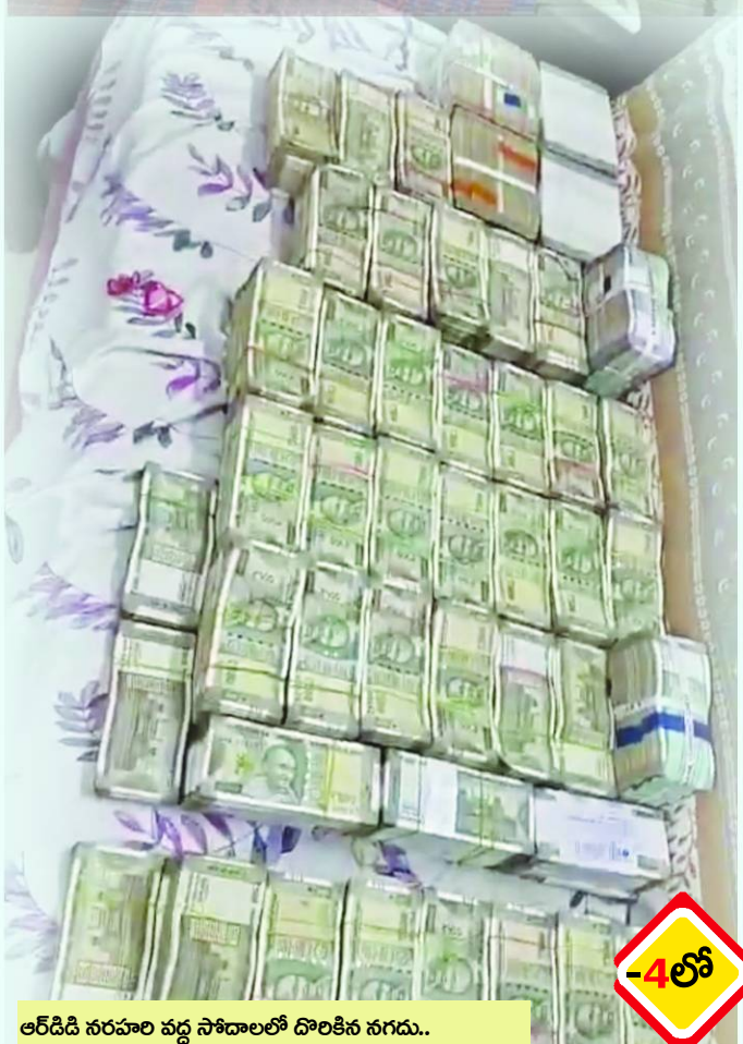
ఆర్డీడి నరహార వద్ద సోదాలలో దొరికిన నగదు..

ఆర్డీడి సర్వేయర్ నరహార అవినీతి సంపాదనపై 'అనిశా' దాడుల్లో దిమ్మతిరిగే అక్రమాస్తులు వెలుగులోకి వస్తున్నాయి.. అవినీతి గనిలో తవ్వినా కొద్ది ఆస్తులు బయట పడుతున్నాయి.. మరోవైపు ఈ ఏసీబి దాడుల నేపథ్యంలో, పలువురు ఫిర్యాదు దారులు ఆయనను సంప్రదించిన సమయంలో, ఆర్డీడి నరహార వ్యవహార శైలిపై కథలు కథలుగా వినిపిస్తున్నాయి.. కుత్సల్యూపూర్ నియోజకవర్గంలోనూ మూడు చోట్ల, సాను చేతివాలటం ప్రదర్శించినట్లు ఆరోపణలు ఉన్నాయి.. బాచుపల్లి మండలం, నిజాంపేట్ గ్రామ పరిధిలోని సర్వే నెం.334 ప్రభుత్వ భూమిని సుమారు 20 గుంటలు "పావని కన్స్ట్రక్షన్" సంస్థ అక్రమంగా మేడ్చల్ జిల్లా కలెక్టర్ ఆర్డీడి సర్వేకు రాసిన లేఖను కూడా, 6 నెలలుగా బెఖాతర్.. గాజులరామారం సర్వే నెం.19 అటవీశాఖ భూమిపై "నేషనల్ గ్రీన్ ట్రిబ్యూనల్" కోర్టు ఆదేశానుసారం సర్వే వ్యవహారం లోనూ, ప్రైవేటు వ్యక్తులకు కట్ట బెట్టినట్లు గ్రహించి ఎన్జిటి నీలయన్.. గాజులరామారంలో సర్వే నెంబర్ 328 పట్టా భూమిలో ఆర్డీడి సర్వే జాప్యంపై అనుమానాలు వ్యక్తం అవుతున్నాయి.. మేడ్చల్ జిల్లా బ్యూరో, పెన్ పవర్, జూన్ 16: