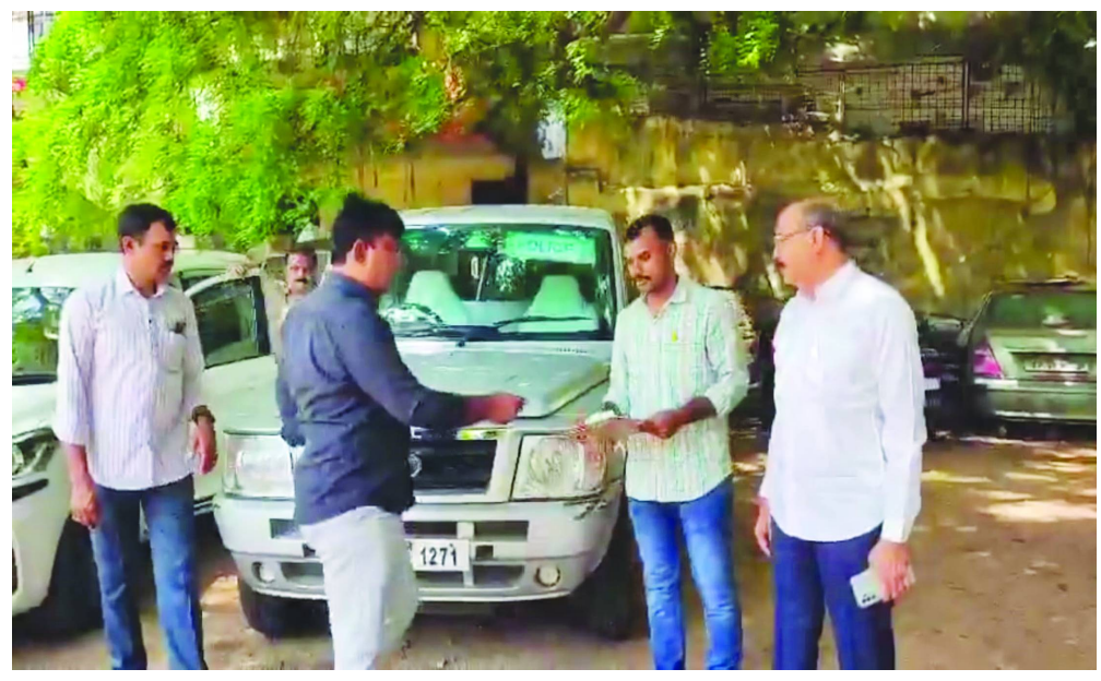
ఆర్డిడి నరహారి ఇంటిపక్కకు చేరుకున్న ఏసిబి అధికారులు.